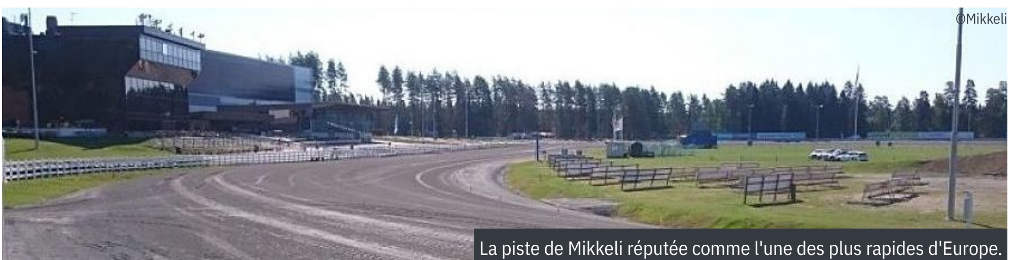
La piste de Mikkeli réputée comme l'une des plus rapides d'Europe.

Les deux candidats hexagonaux auront six opposants, dimanche, dont le lauréat de l'an dernier, Next Direction , qui ouvrira les hostilités en quatrième position derrière l'autostart. Eux n'ont pas forcément été gâtés par le tirage au sort, en particulier Face Time Bourbon , au couloir 7, tandis que Billie de Montfort a hérité du numéro 5. Ils sont cependant, tous les deux, très véloce et capables d'effacer, d'emblée, ceux qui sont à leur intérieur. Parmi ceux-ci, l'italien Vitruvio (couloir 1) et les scandinaves Evaluate (couloir 2) et Seismic Wave (couloir 3). Run For Royalty s'élancera, pour sa part, entre nos deux représentants, au couloir 6, alors que Grainfield Aiden partira tout à l'extérieur. Cela devrait être un grand moment, avec, peut-être, à un an d'intervalle, un nouveau record à la clef. Et « quid » du record d'Europe du mile, détenu, après la déchéance de Propulsion (1'08"1), par Ringostarr Treb , en 1'08"2 ? ■