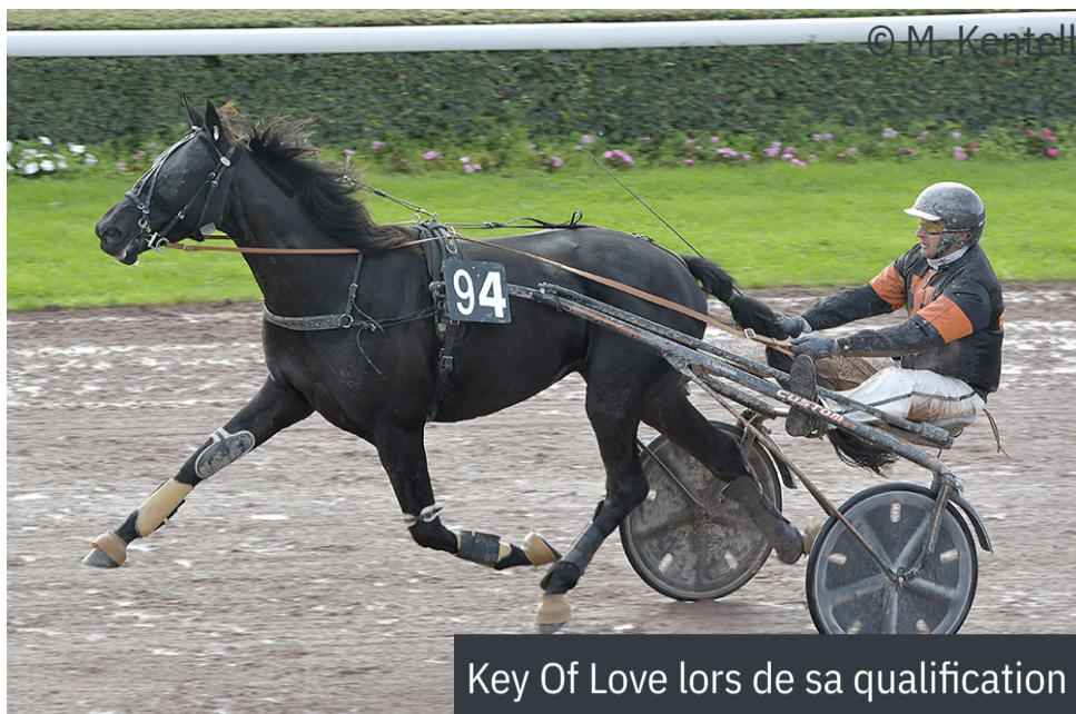
Key Of Love lors de sa qualification