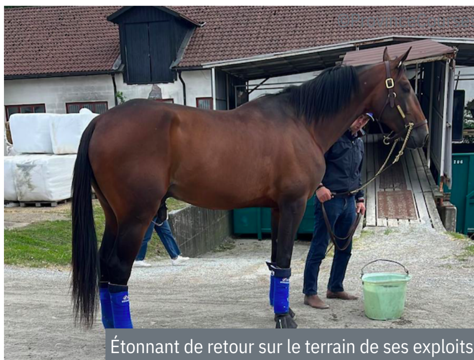
Étonnant de retour sur le terrain de ses exploits