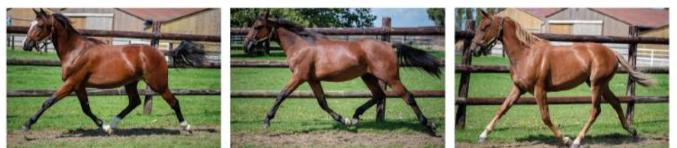
Lot 371 MILORD DE TILLARD VERY NICE MARCEAUX / DIVA DE TILLARD (SEVERINO) Lot 392 MAGIC DE TILLARD FADO DU CHÊNE / ENERGIE DE TILLARD (RIEUSSEC) Lot 423 MAESTRO DE TILLARD UNICLOVE / EUREKA DE TILLARD (FIRST DE RETZ)