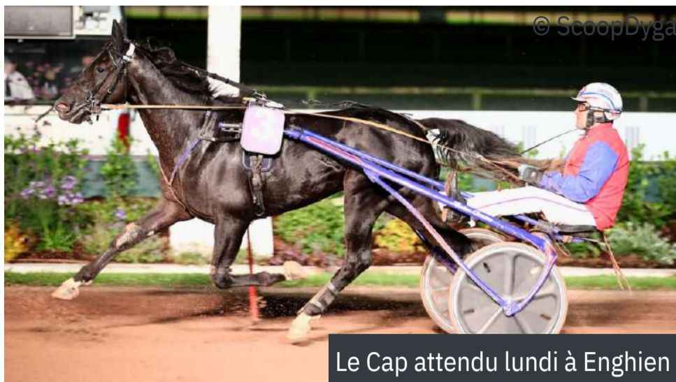
Le Cap attendu lundi à Enghien