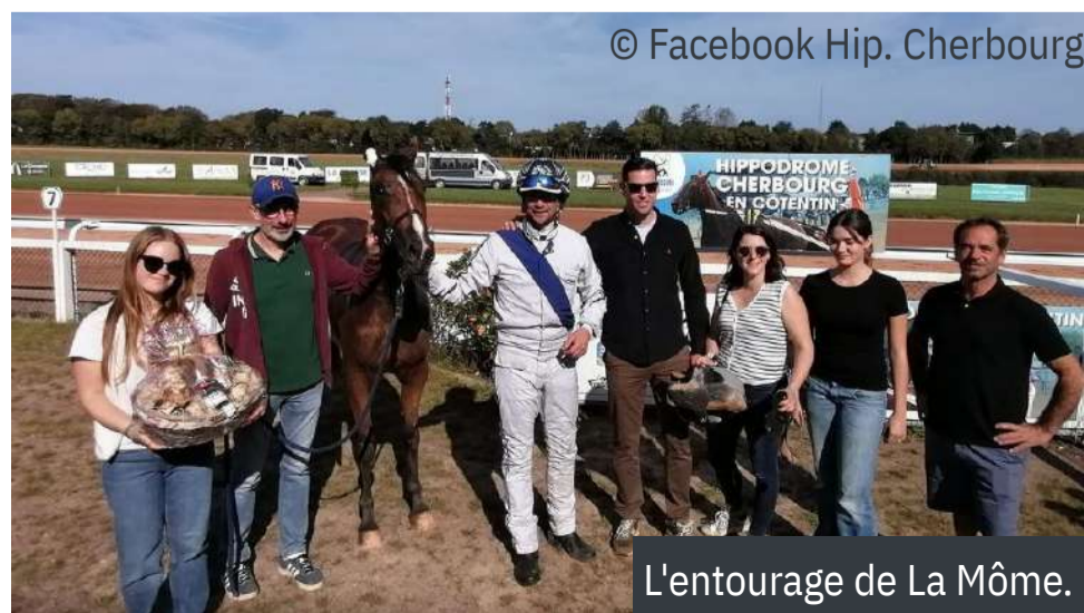
L'entourage de La Môme.