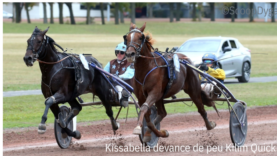
Kissabella devance de peu Kilim Quick