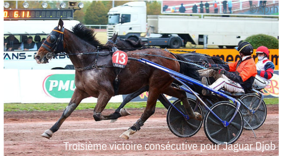
Troisième victoire consécutive pour Jaguar Djob

4 e : Beethoven (swe) - 5 e : Hamour de Sissi - 6 e : Historien Galbe - 7 e : Holka du Lys