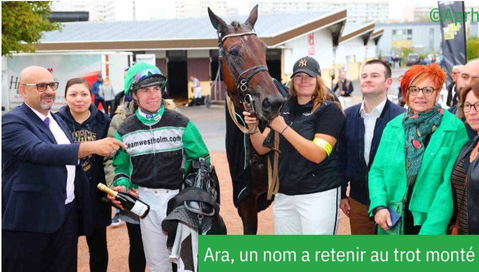
Ara, un nom à retenir au trot monté