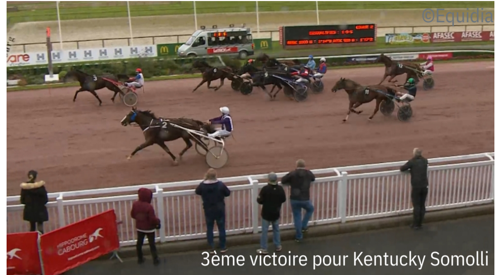
3ème victoire pour Kentucky Somolli

4 e : Letty de Beylev - 5 e : Laurelina - 6 e : Louranga de Nile - 7 e : La Reine de Beylev