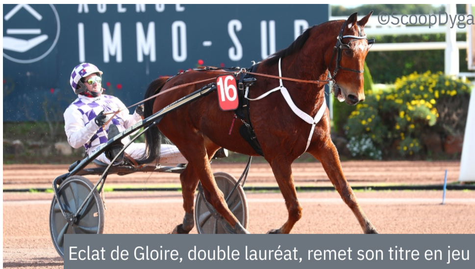
Eclat de Gloire, double lauréat, remet son titre en jeu