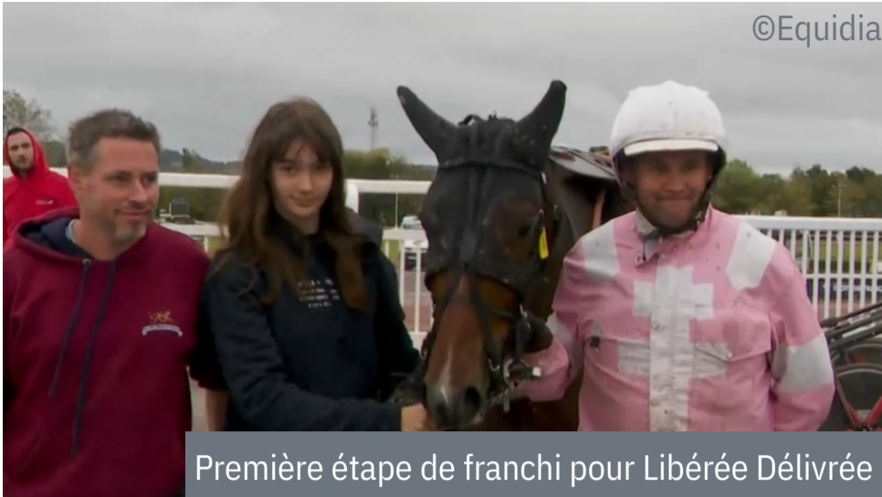
Première étape de franchi pour Libérée Délivrée