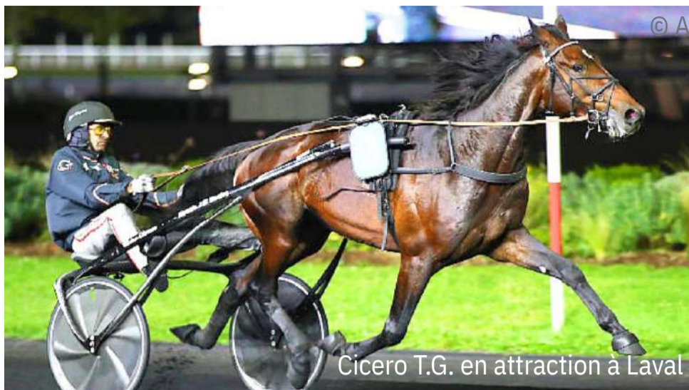
Cicero T.G. en attraction à Laval