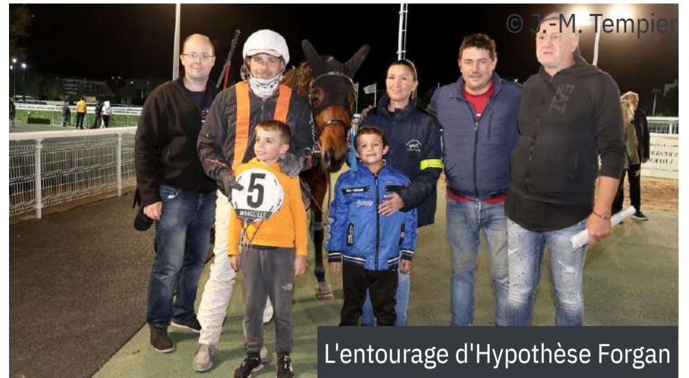
L'entourage d'Hypothèse Forgan

4 e : Disco d'Occagnes - 5 e : Gounit de l'Airou - 6 e : Fleuron du Linais - 7 e : Equiano