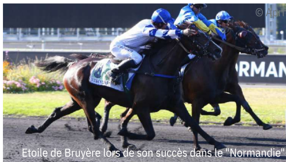
Etoile de Bruyère lors de son succès dans le "Normandie"

Etoile de Bruyère entre dorénavant au haras pour sa carrière de poulinière. Le nom de son premier serviteur n'est pas encore connu.