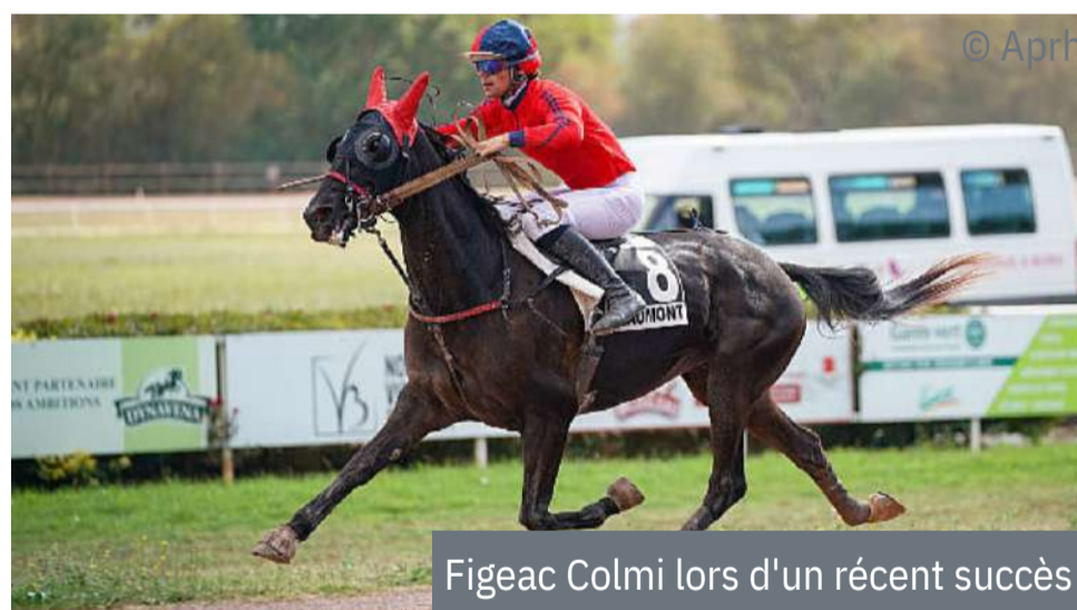
Figeac Colmi lors d'un récent succès

Un autre numéro supplémentaire (177A) concerne le volet élevage avec Diana des Lucas ( Magnificent Rodney ), une fille gagnante de la semi-classique Quinta des Lucas présentée pleine d' Orlando Vici (Quadrophénio).