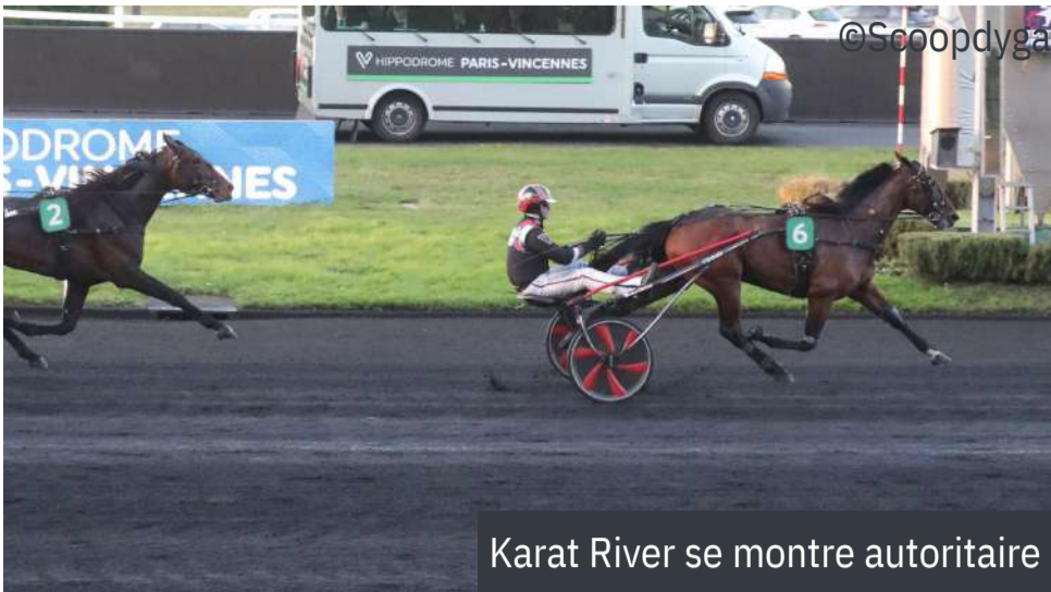
Karat River se montre autoritaire