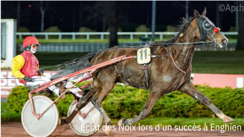
Éclat des Noix lors d'un succès à Enghien