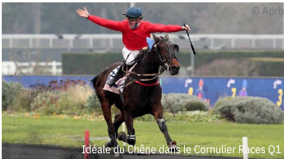
Idéale du Chêne dans le Cornulier Races Q1