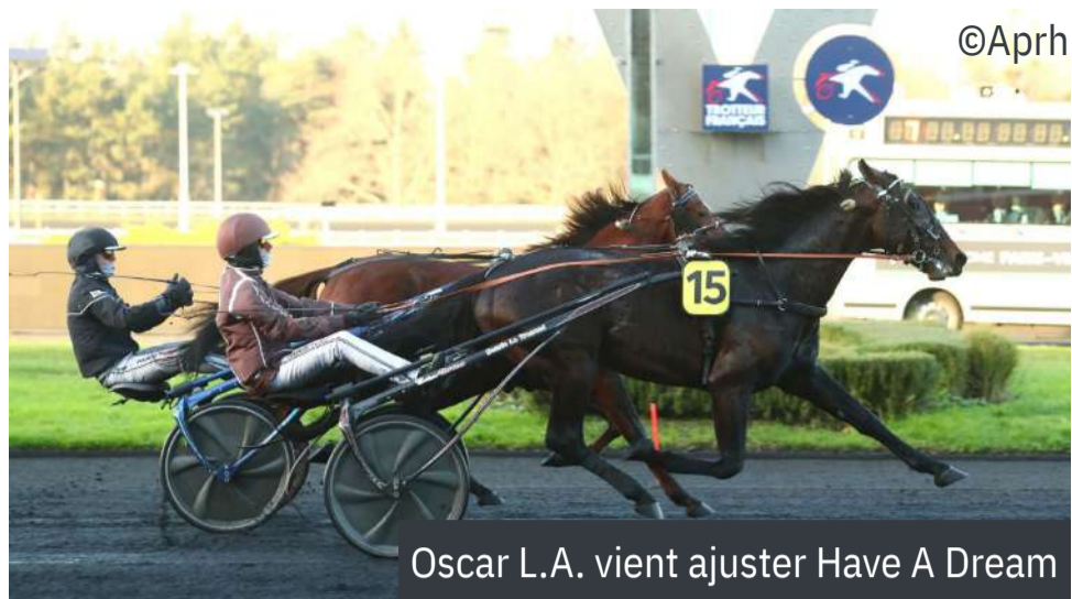
Oscar L.A. vient ajuster Have A Dream