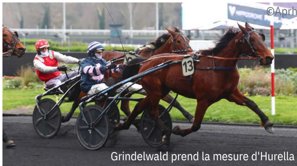
Grindelwald prend la mesure d'Hurella