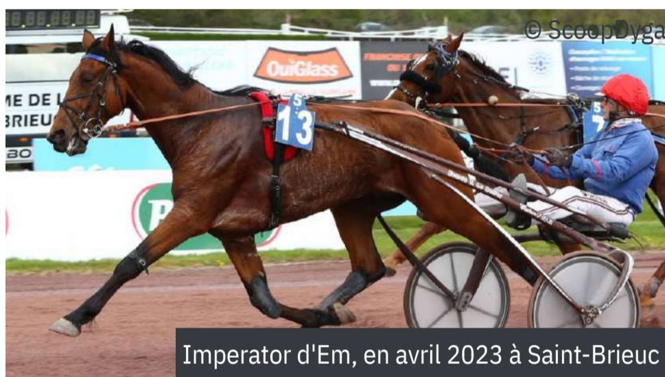
Imperator d'Em, en avril 2023 à Saint-Brieuc