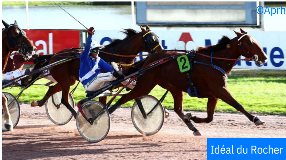
Idéal du Rocher