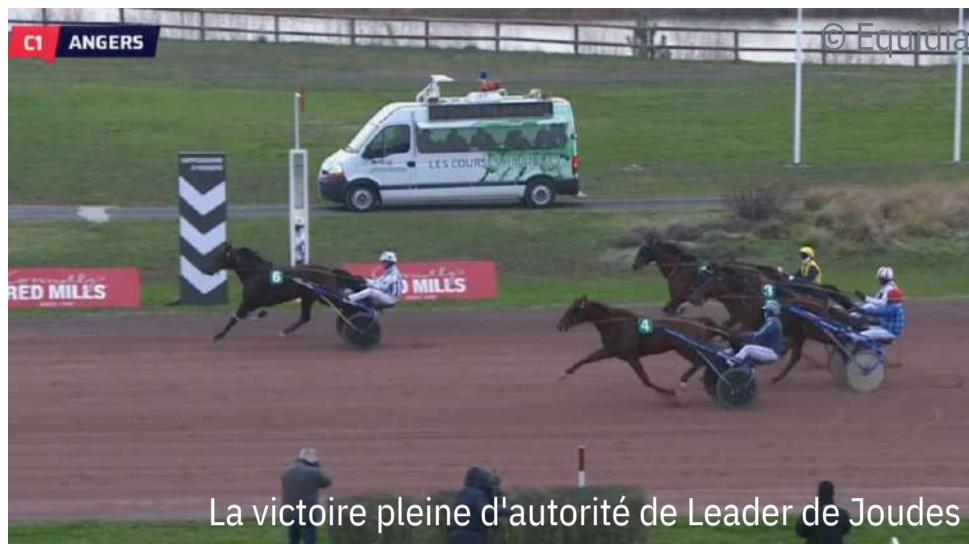
La victoire pleine d'autorité de Leader de Joudes