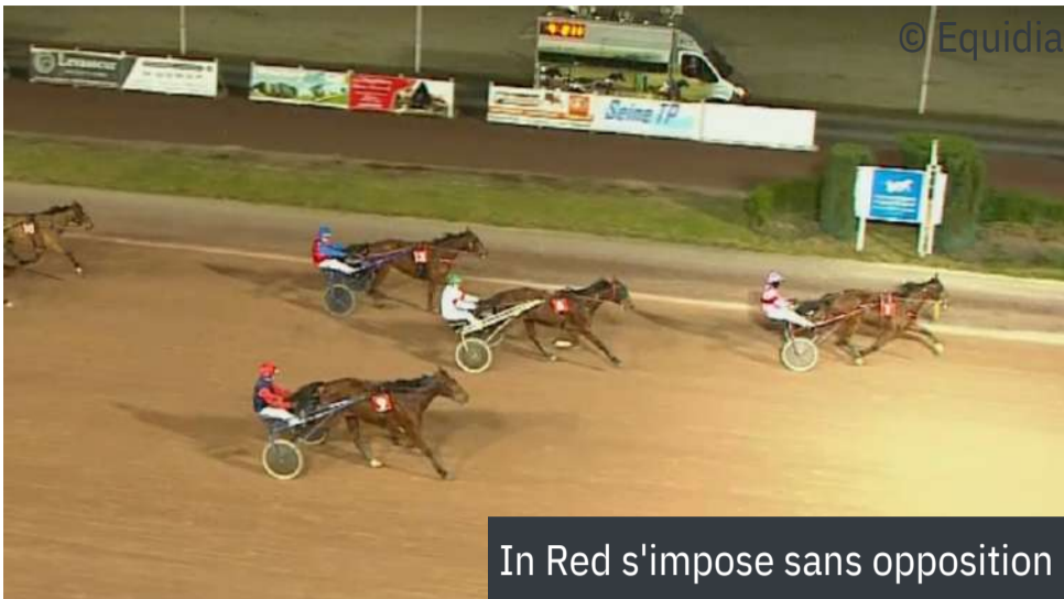
In Red s'impose sans opposition