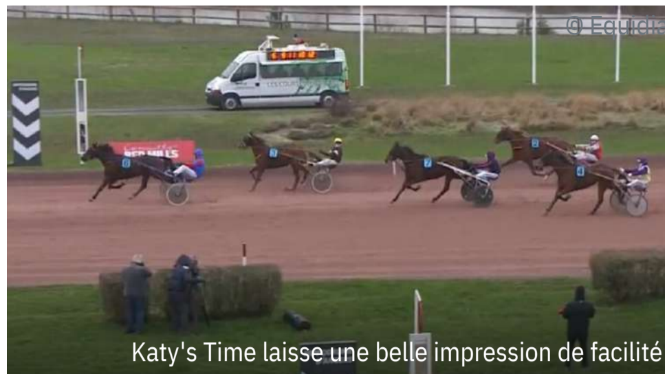
Katy's Time laisse une belle impression de facilité