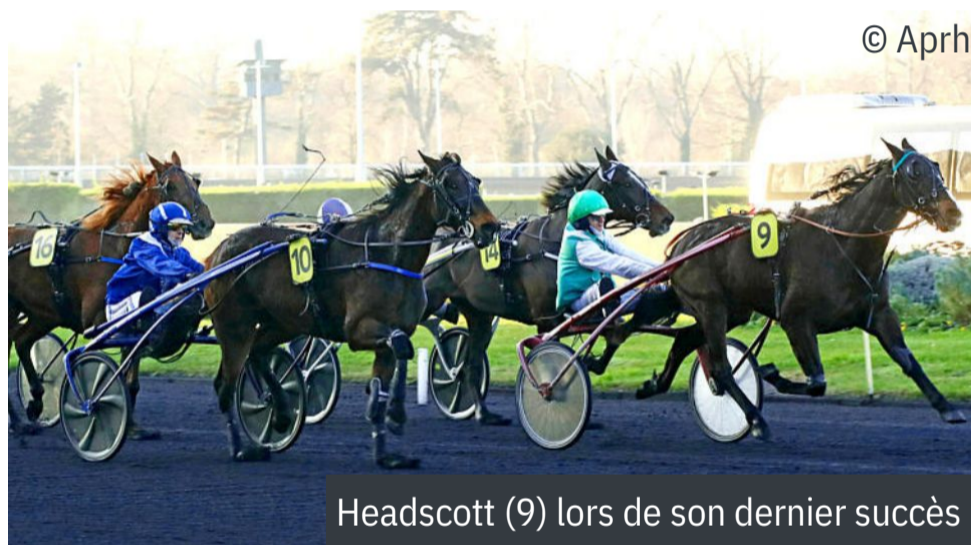
Headscott (9) lors de son dernier succès