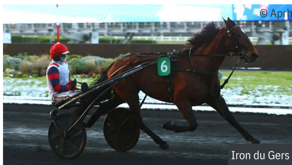
Iron du Gers

Le Prix de Yonkers Raceway réunit un bon lot de 6 ans parmi lesquels Iron du Gers ( Love You ) et Idéal Green ( Up The Green ) semblent en mesure de jouer les premiers rôles sur ce parcours de vitesse où ils s'élanceront respectivement avec les numéros 9 et 2 derrière les ailes de l'autostart. Déferré des quatre pieds, le premier a remporté six courses et pris deux deuxième places en neuf tentatives dans cette configuration. Le second a trotté dans la réduction kilométrique de 1'10"6 sur ce parcours lors de son succès le 21 novembre.