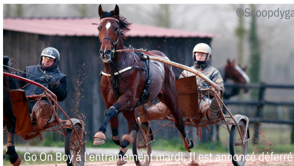
Go On Boy à l'entraînement mardi. Il est annoncé défermé