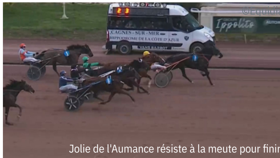
Jolie de l'Aumance résiste à la meute pour finir

4 e : Kantissime Winner - 5 e : Klimt Merite - 6 e : Kristal Dream - 7 e : Kieffer d'Ourville