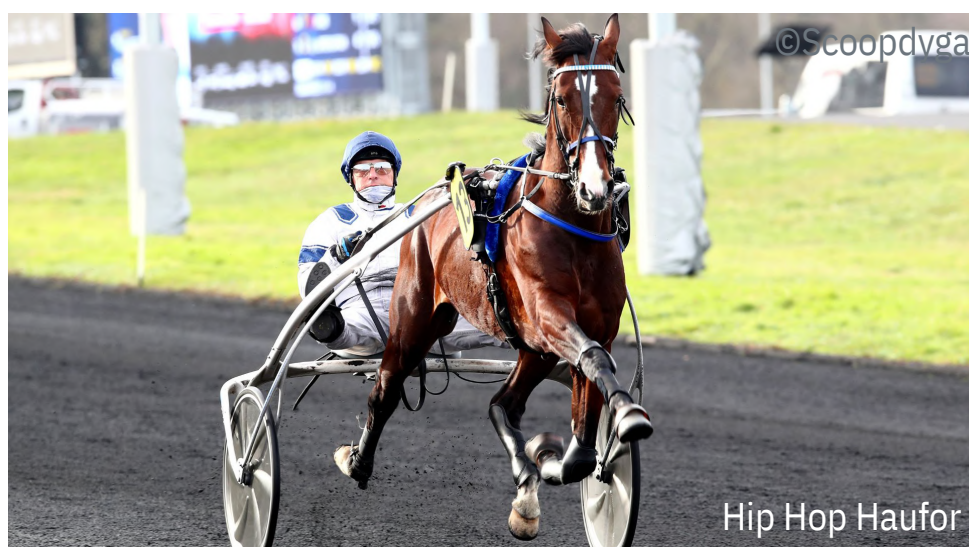
Hip Hop Haufor

Course de niveau A disputée sur les 2.100 mètres départ autostart, le Prix de Munich (course 4) affiche un palmarès particulièrement flatteur. En 2023, Hokkaido Jiel ( Brillantissime ) s'imposait dans cette course avant de terminer deuxième du Prix d'Amérique Legend Race (Gr.1) 2024. En 2022, c'est Ampia Mede Sm (Ganymede) qui a franchi le poteau en tête avant de terminer deuxième du Prix d'Amérique 2023 et de remporter ensuite brillamment les Prix de France Speed Race (Gr.1) et de Paris Marathon Race (Gr.1). Et si cette course servait encore cette année de tremplin à son lauréat pour la plus grande course du dernier dimanche de janvier 2025 ? Le plateau est en tout cas des plus intéressants avec la présence notable de Hip Hop Haufor ( Up And Quick ),... 4ème du Prix d'Amérique 2023.