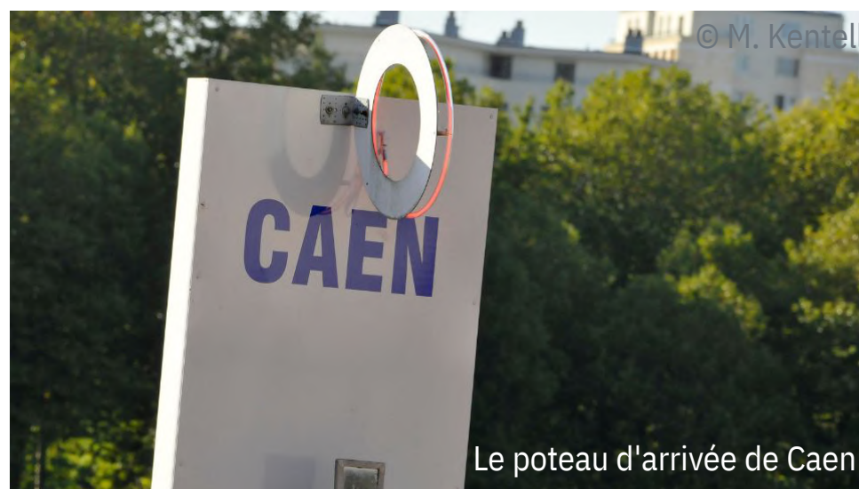
Le poteau d'arrivée de Caen

En raison des festivités liées au 80ème anniversaire du Débarquement et de la bataille de Normandie, entraînant des restrictions de circulation, la séance de qualifications initialement prévue le jeudi 6 juin sur l'hippodrome de Caen est avancée au lundi 3 juin et devient une séance réservée aux 3 et 4 ans, tandis que la séance du mardi 4 juin est maintenue mais devient ouverte aux 2 ans.