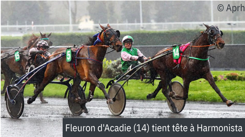
Fleuron d'Acadie (14) tient tête à Harmonista