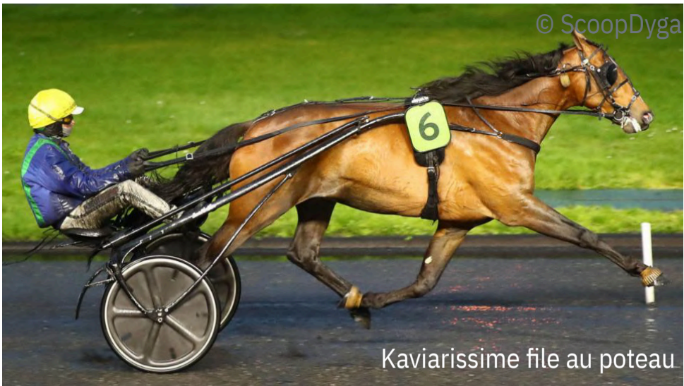
Kaviarissime file au poteau