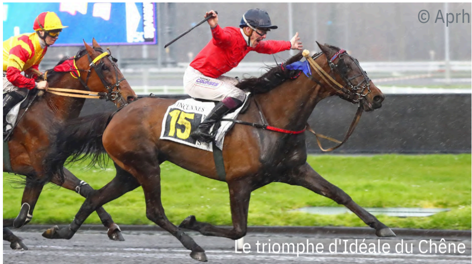
Le triomphe d'Idéale du Chêne