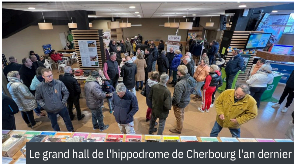
Le grand hall de l'hippodrome de Cherbourg l'an dernier