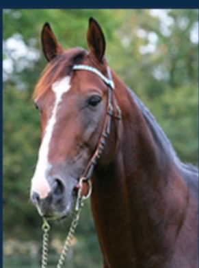
HIP HOP HAUFOR

PARIS HAUFOR - TIEGO D'ÉTANG - HIP HOP HAUFOR - GALA TEJY