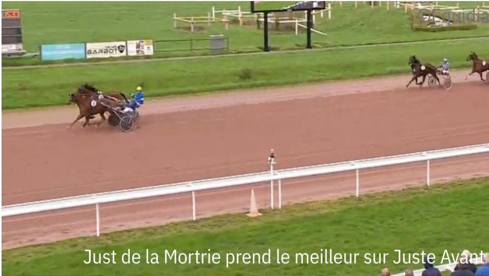
Just de la Mortrie prend le meilleur sur Juste Avant