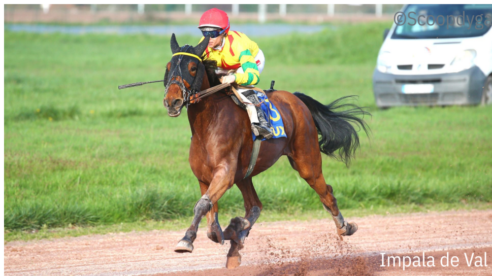
Impala de Val