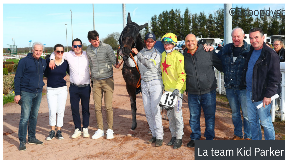
La team Kid Parker

4 e : Gai Matin - 5 e : Flocon Digeo - 6 e : Hexode de Felliére - 7 e : Halicia Bella