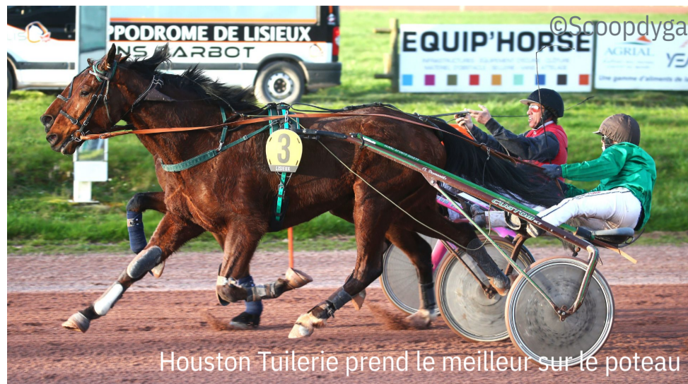
Houston Tuilerie prend le meilleur sur le poteau

4 e : Imagine d'Atout - 5 e : Faust de Beylev - 6 e : Isaac de Syva - 7 e : Fakir Gascon