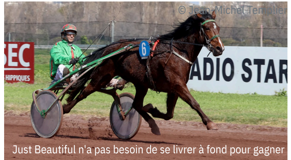
Just Beautiful n'a pas besoin de se livrer à fond pour gagner

4 e : Kemma des Loyaux - 5 e : Kalinka de Vandel - 6 e : Kandy du Midi - 7 e : Kouba The Best