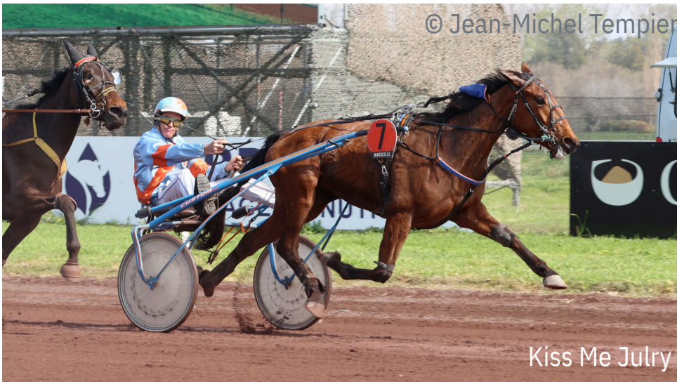
Kiss Me Julry