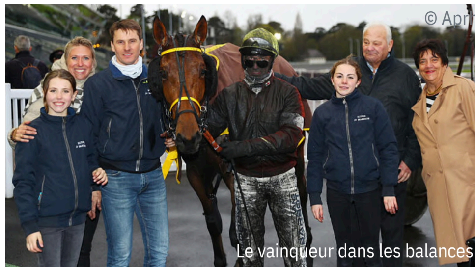
Le vainqueur dans les balances