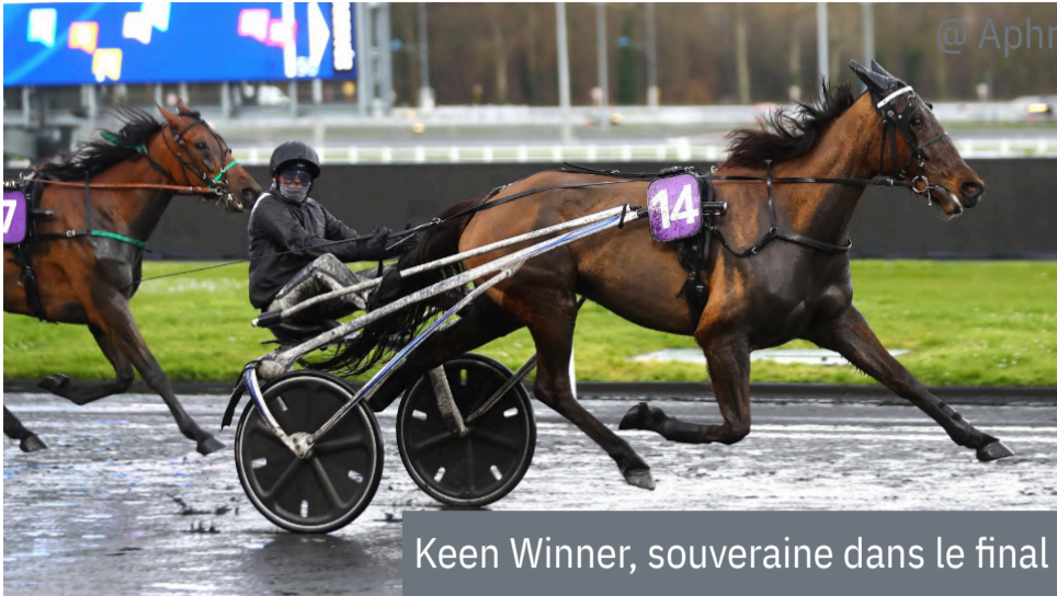
Keen Winner, souveraine dans le final