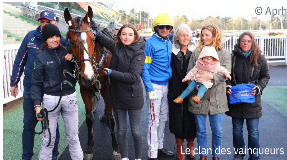
Le clan des vainqueurs