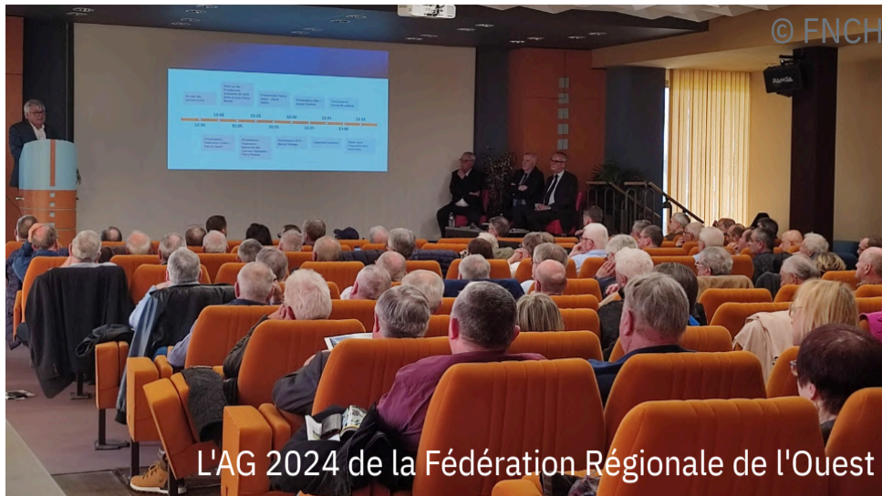
L'AG 2024 de la Fédération Régionale de l'Ouest