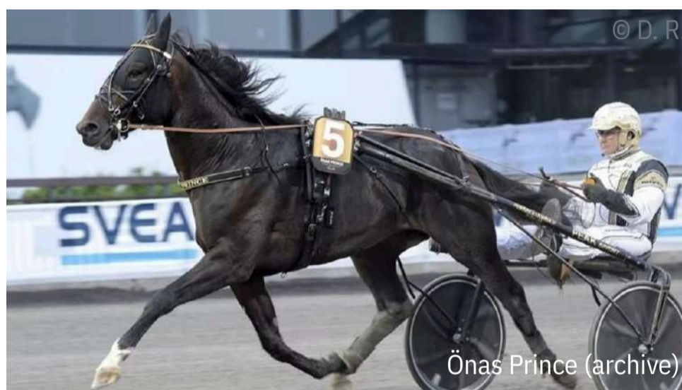
Önas Prince (archive)

Ce samedi à Åby (Suède), ÖNAS PRINCE (Chocolatier) a remporté la première épreuve qualificative de la Paralympiatravet (Groupe 1) qui aura lieu le samedi 4 mai sur la même piste. Le plus titré au départ avec ses trois victoires de Groupe 1, le partenaire de Per Nordström s'est imposé dans la réduction kilométrique de 1'11"8 sur la distance de 2.140 mètres. La prochaine des deux autres épreuves qualificatives aura lieu samedi prochain (le 13 avril) à Bergsåker.