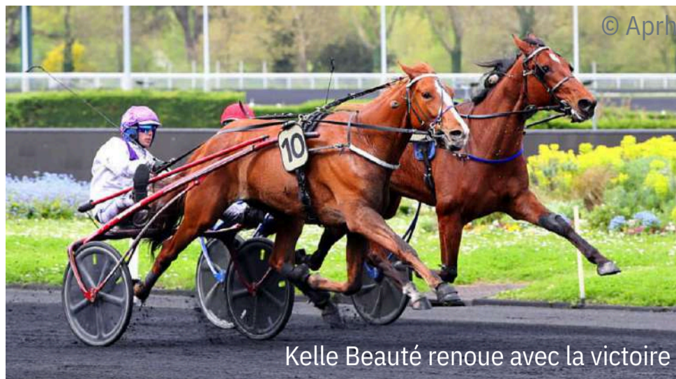
Kelle Beauté renoue avec la victoire