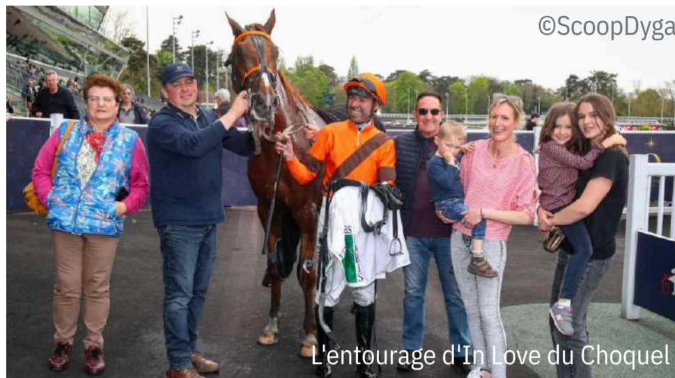
L'entourage d'In Love du Choquel