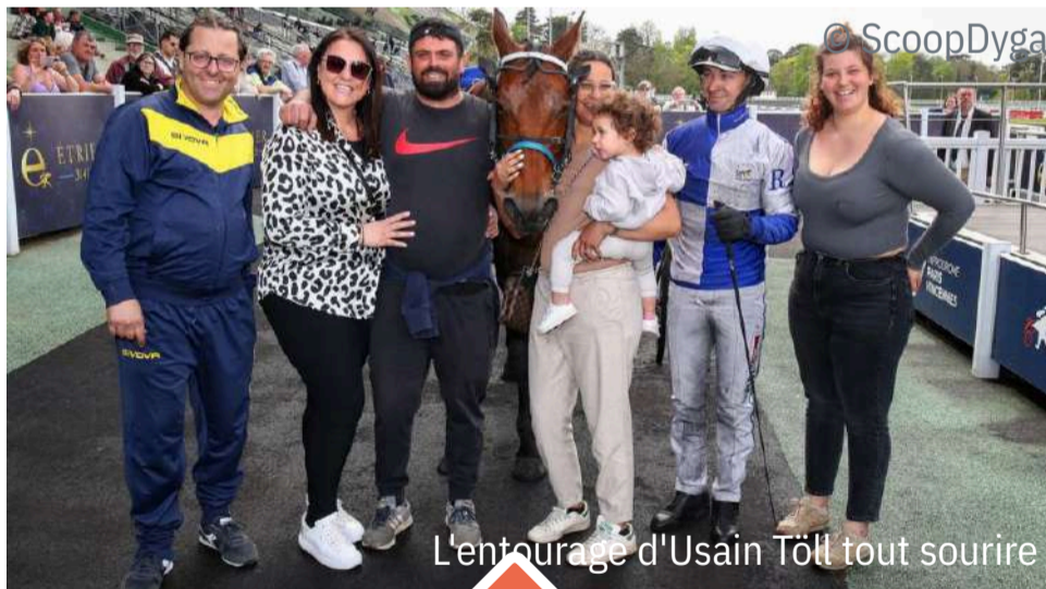
L'entourage d'Usain Töll tout sourire