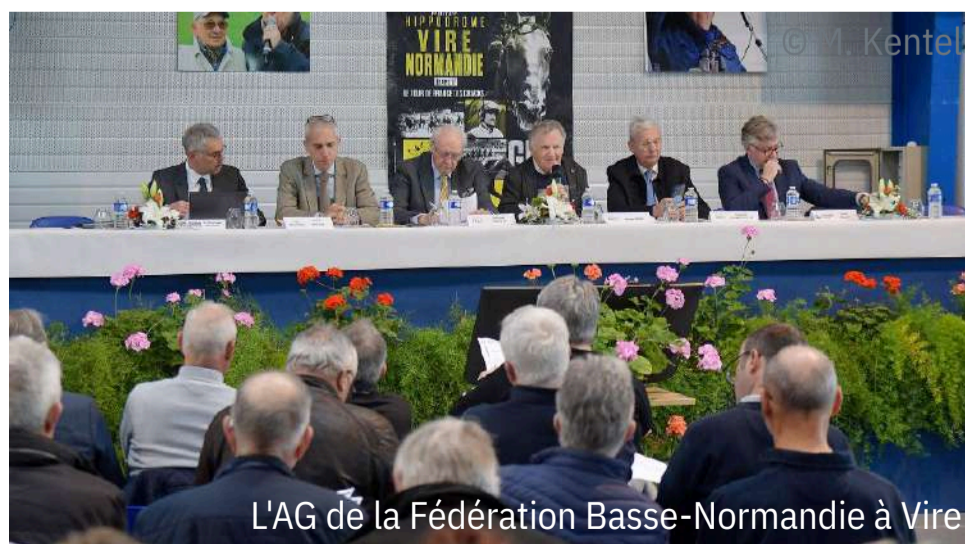
L'AG de la Fédération Basse-Normandie à Vire