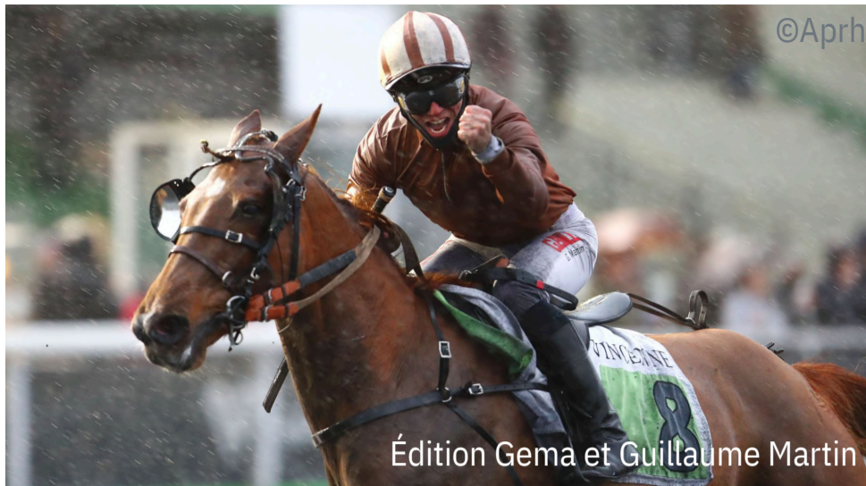
Édition Gema et Guillaume Martin