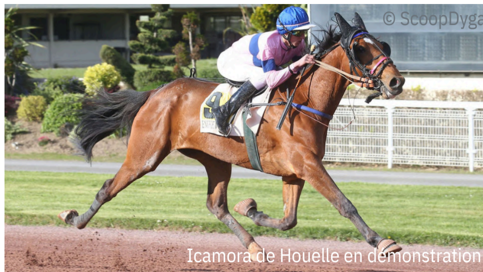
Icamora de Houelle en démonstration

4 e : Kika Josselyn - 5 e : Kagnotte d'Azif - 6 e : Kateline de Bry - 7 e : Kanelle Star