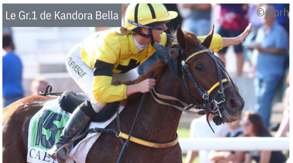
Le Gr.1 de Kandora Bella