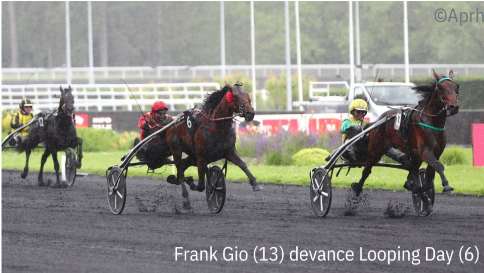
Frank Gio (13) devance Looping Day (6)