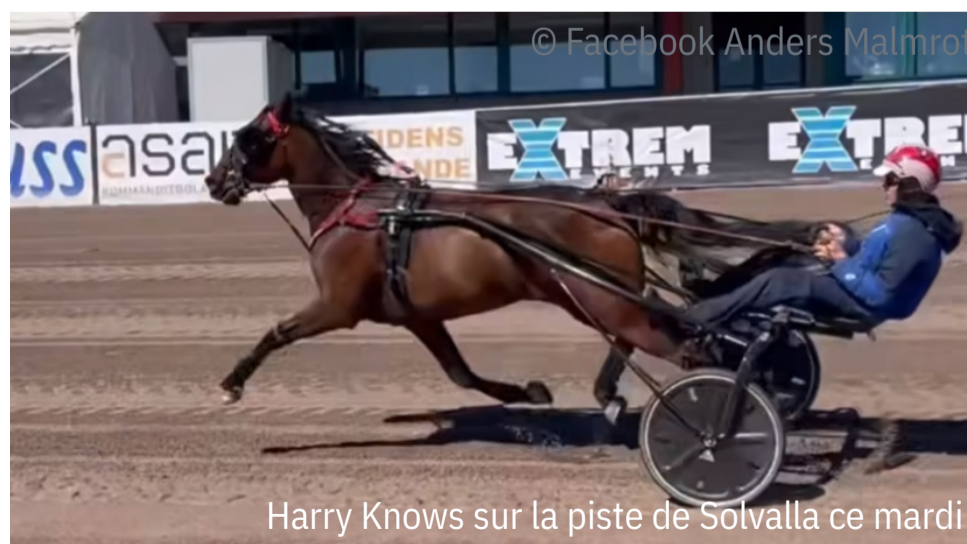
Harry Knows sur la piste de Solvalla ce mardi