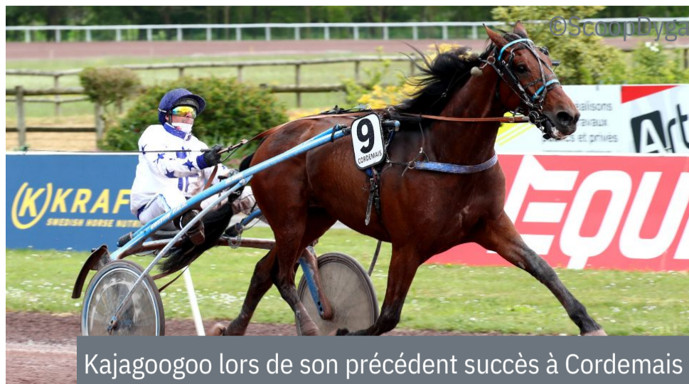
Kajagoogoo lors de son précédent succès à Cordemais