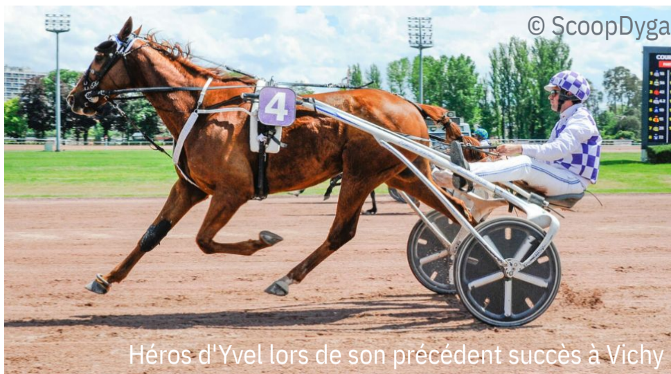
Héros d'Yvel lors de son précédent succès à Vichy