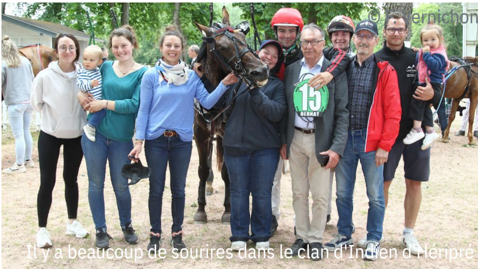
Il y a beaucoup de sourires dans le clan d'Indien d'Hériprié