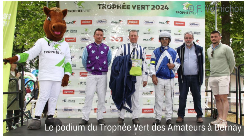
Le podium du Trophée Vert des Amateurs à Bernay

4 e : Harmonie de Sita - 5 e : Halizee des Isles - 6 e : Ibero Bello - 7 e : Huron des Landiers