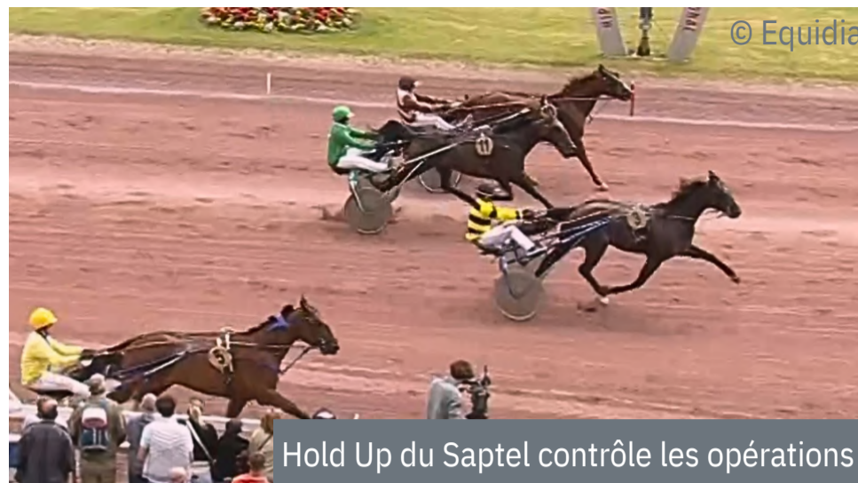
Hold Up du Saptel contrôle les opérations

4 e : Lifou iris'Eyes - 5 e : Laos Jiel - 6 e : Lady du Pommereux - 7 e : Louna d'Or