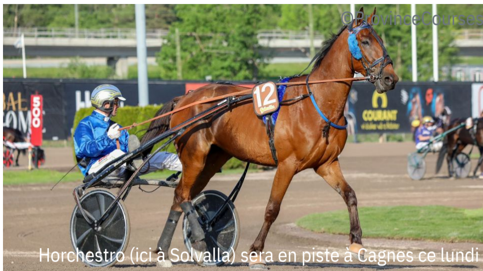
Horchestra (ici à Solvalla) sera en piste à Cagnes ce lundi