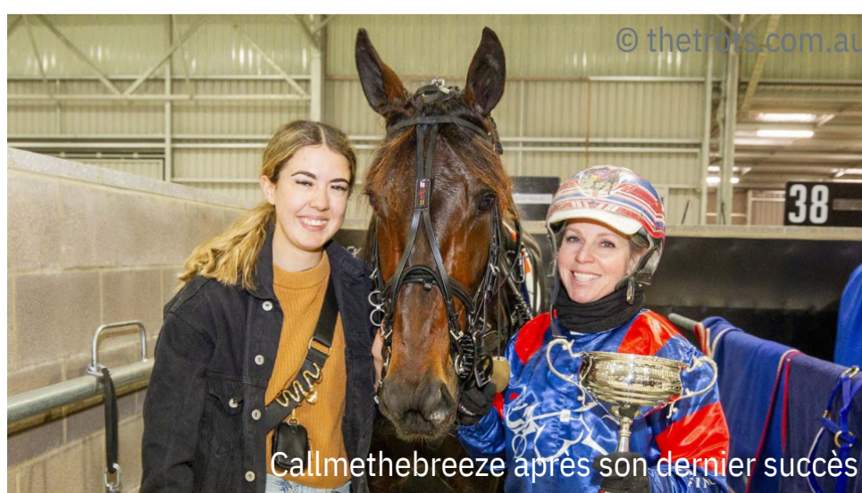
Callmethebreze après son dernier succès