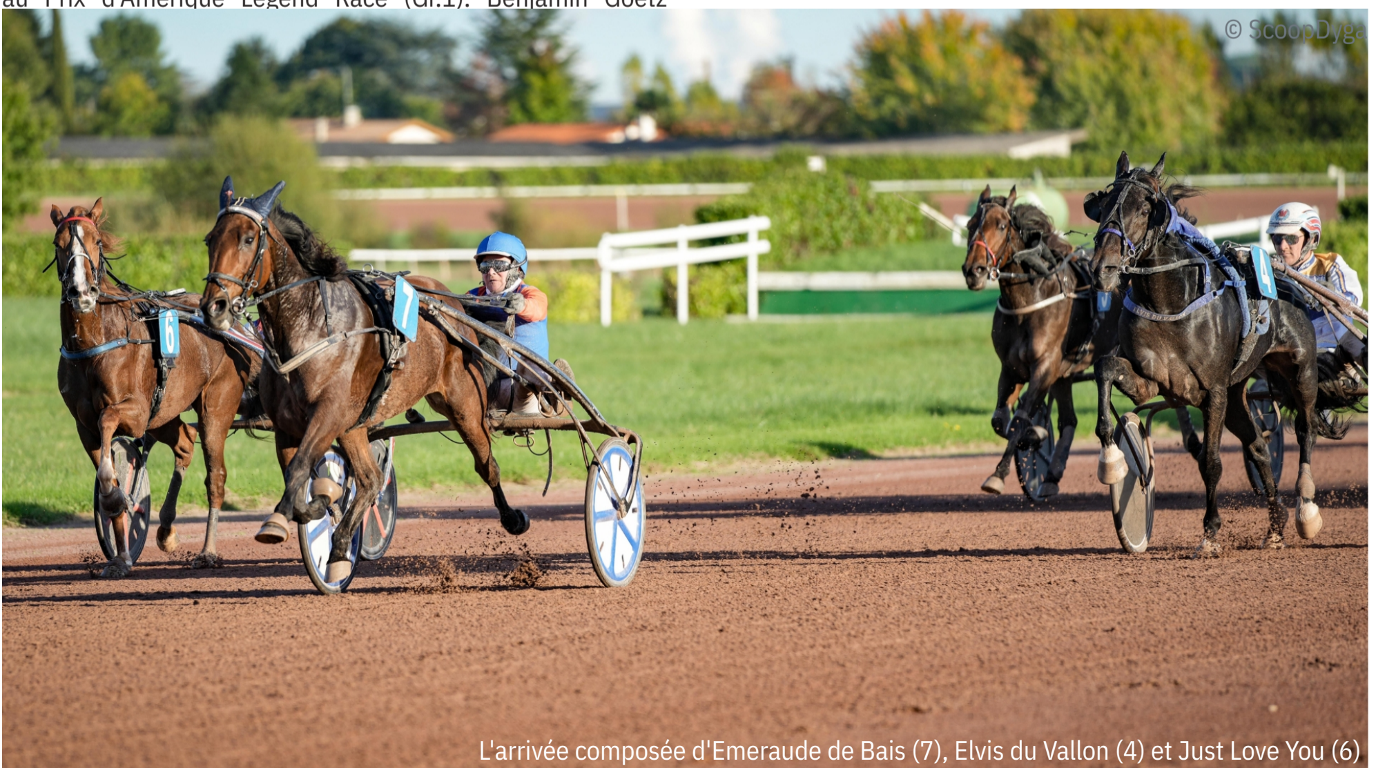
L'arrivée composée d'Emeraude de Bais (7), Elvis du Vallon (4) et Just Love You (6)

4 e : Hooker Berry - 5 e : Just A Gigolo - 6 e : Hanna des Molles - 7 e : Joyner Sport