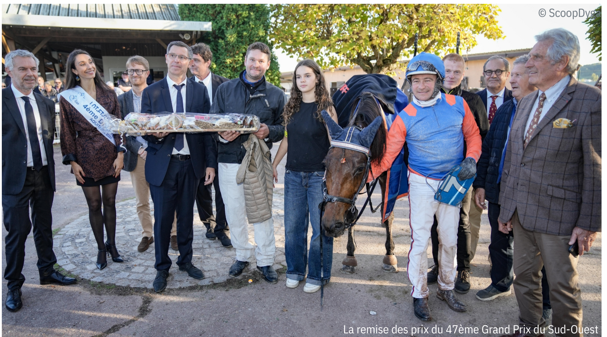
La remise des prix du 47ème Grand Prix du Sud-Ouest