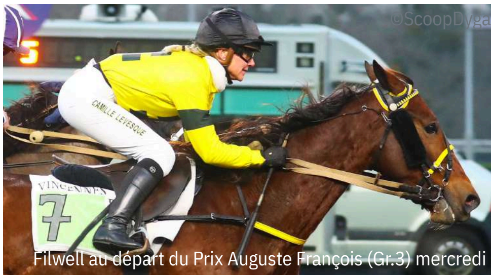
Filwell au départ du Prix Auguste François (Gr.3) mercredi