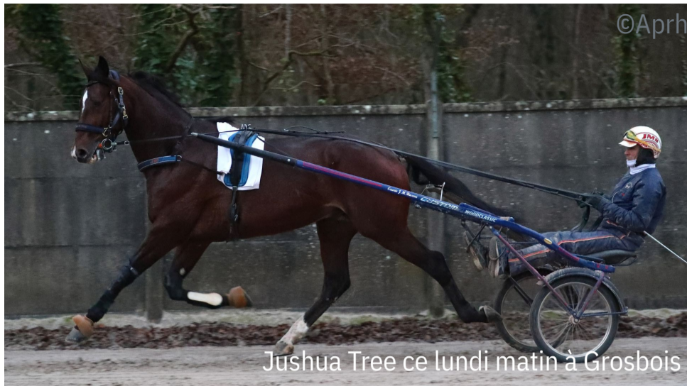
Jushua Tree ce lundi matin à Grosbois