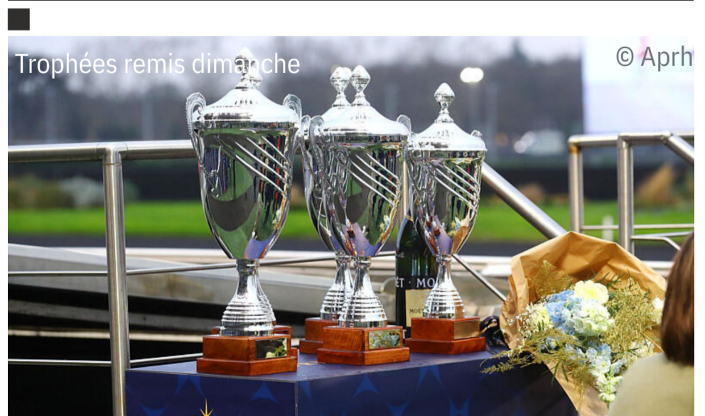
Trophées remis dimanche

Fille d'une gagnante de Quinté+ à Vincennes, Missrev (Acteur Tilly), qui a aussi donné au haras Deepstack ( Royal Dream ), titulaire de plus de 157.000 €, All In Las Vegas ( Magnificent Rodney ), double gagnante en 25 courses, compte à ce jour deux qualifiés sur six naissances. Avant Jezabelle Bie , elle a donné le jour à Hautentica (Sam Bourbon), titulaire de 10 succès (dont six au monté).