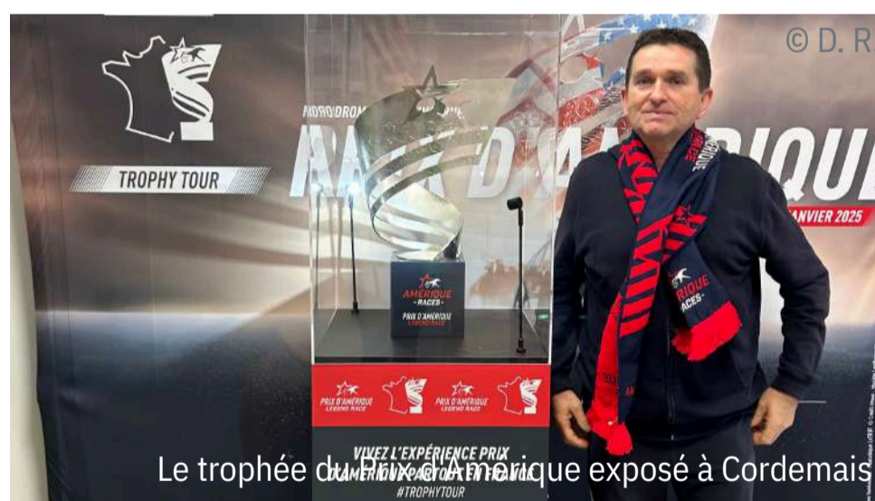
Le trophée du Prix d'Amérique exposé à Cordemais

Connolly's RED MILLS SINCE 1908 NOURRIR VOTRE DÉSIR DE GAGNER