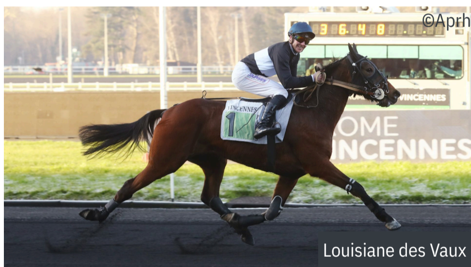
Louisiane des Vaux