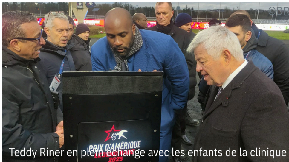
Teddy Riner en plein échange avec les enfants de la clinique