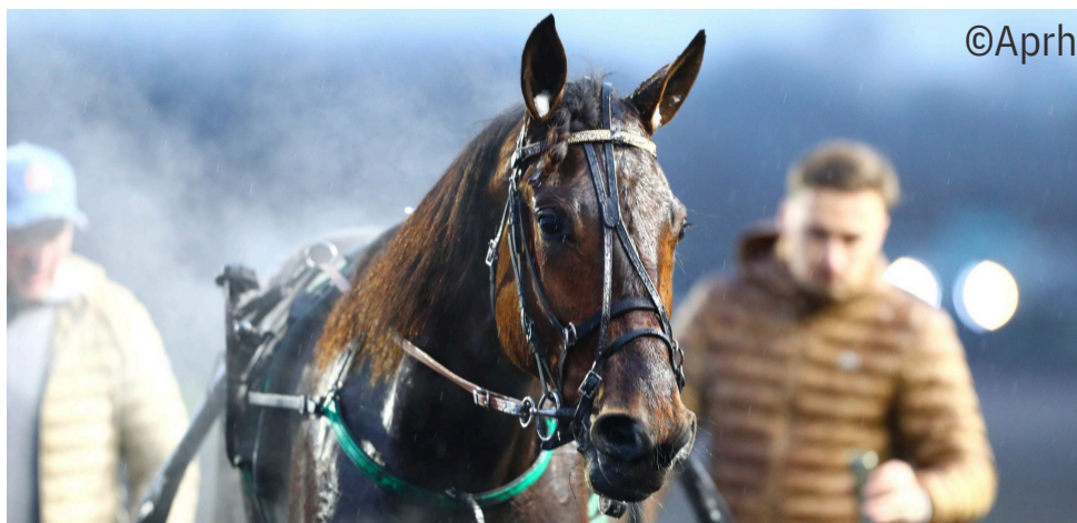
Golden Gio, un des quatre vainqueurs de Face Time Bourbon