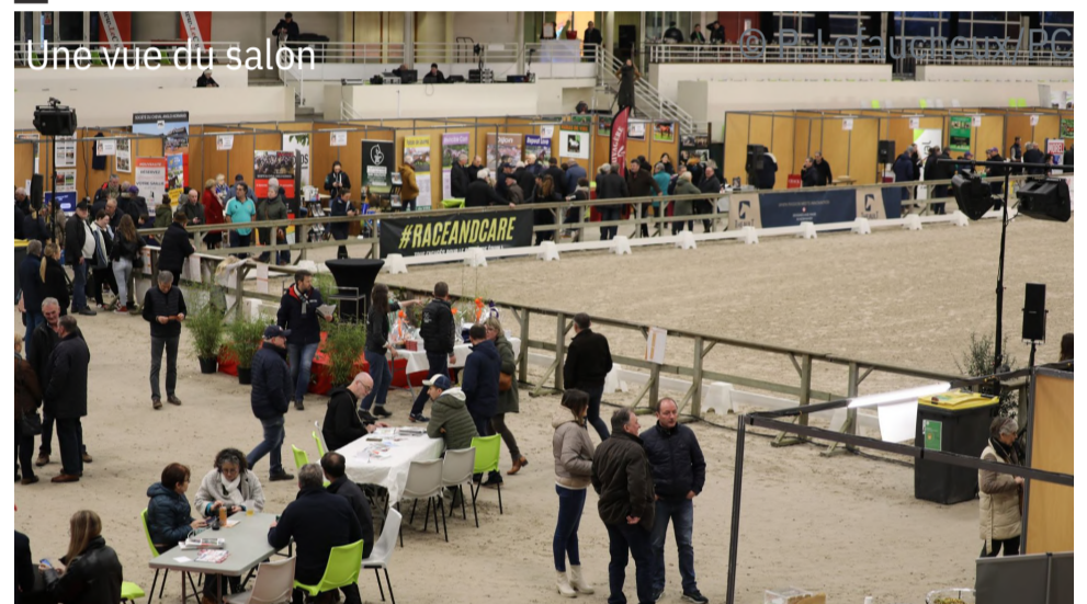
Une vue du salon

Les saillies et le règlement des tirages au sort sont à retrouver sur www.salondutrotnormandie.fr