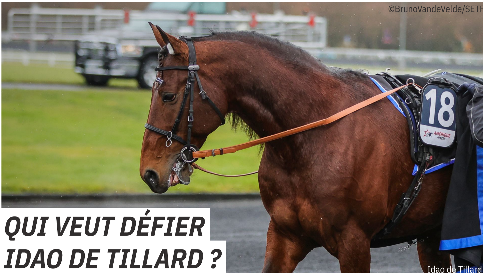
Idao de Tillard