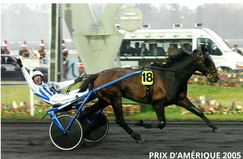
PRIX D'AMÉRIQUE 2005