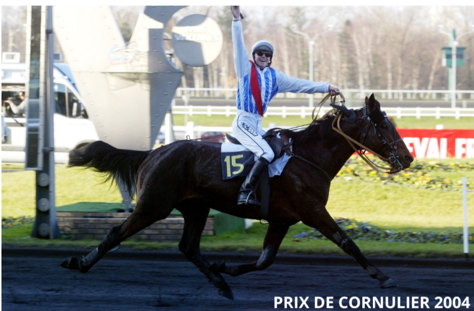
PRIX DE CORNULIER 2004