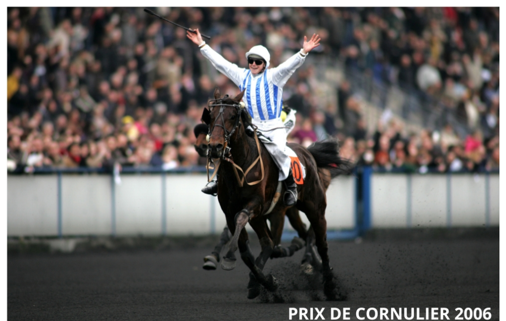
PRIX DE CORNULIER 2006