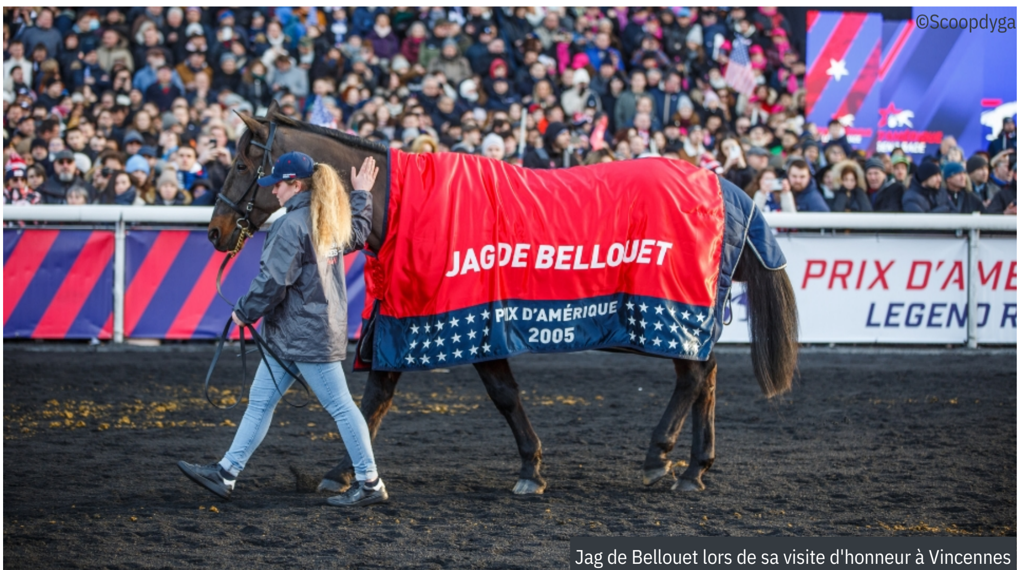
Jag de Bellouet lors de sa visite d'honneur à Vincennes