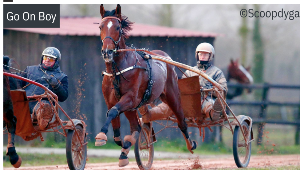
Go On Boy