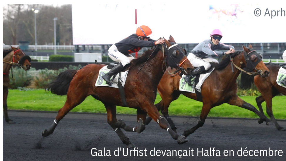
Gala d'Urfist devançait Halfa en décembre