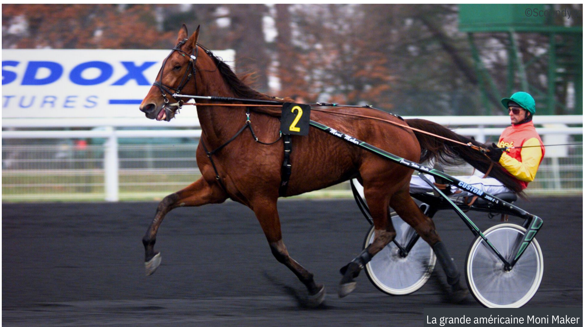
La grande américaine Moni Maker