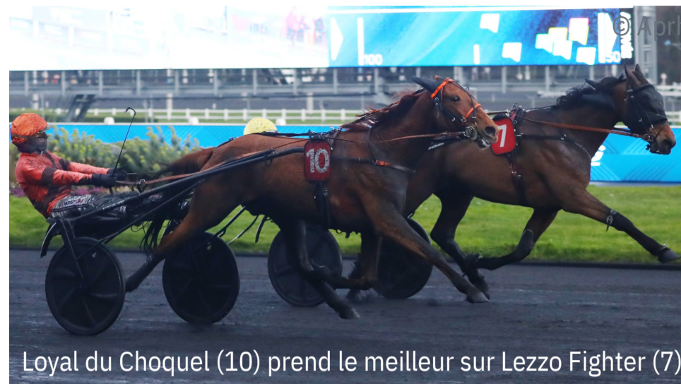
Loyal du Choquel (10) prend le meilleur sur Lezzo Fighter (7)