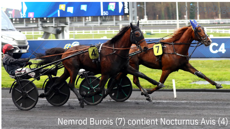
Nemrod Burois (7) contient Nocturnus Avis (4)