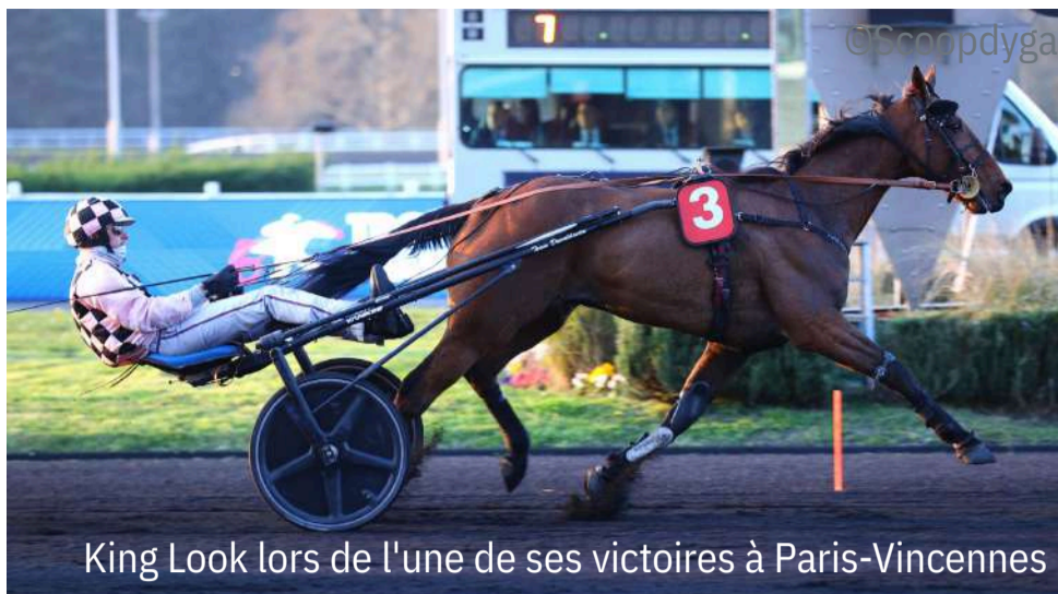
King Look lors de l'une de ses victoires à Paris-Vincennes