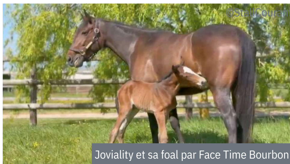
Joviality et sa foal par Face Time Bourbon