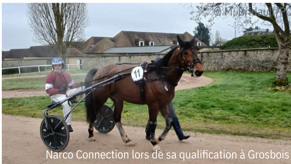
Narco Connection lors de sa qualification à Grosbois