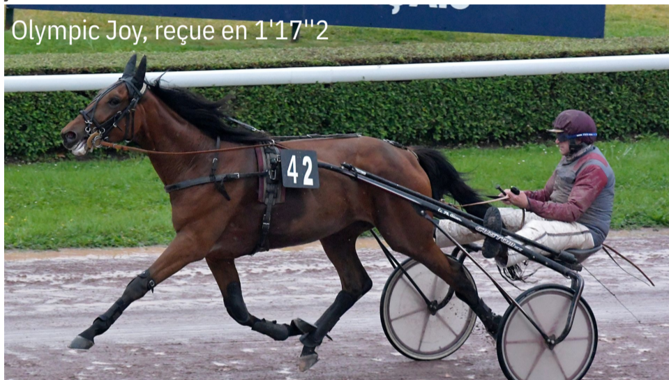
Olympic Joy, reçue en 1'17"2

La première séance pour 2 ans de 2025, dédiée aux "N" et organisée également à Caen, avait été moins dense que celle animée ce mardi par les "O". Avec 66,6 % de réussite (54 qualifiés pour 81 présentés) et un top chrono d'1'16"6, apanage de Nairobi Matidy ( Hohneck ), les aînés sont en retrait sur leurs successeurs. En revanche, lors de la deuxième séance caennaise pour 2 ans, le mercredi 7 mai 2025, Not A Bad Deal ( Inouï Danica ) avait signé la réduction kilométrique d'1'15"4, faisant donc mieux que les 1'15"6 du jour d' Oswald Port .