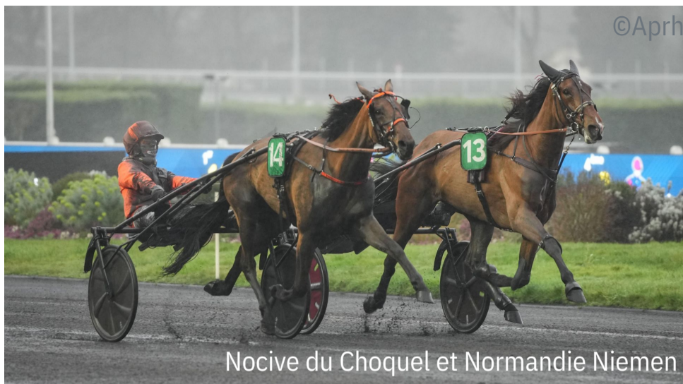
Nocive du Choquel et Normandie Niemen