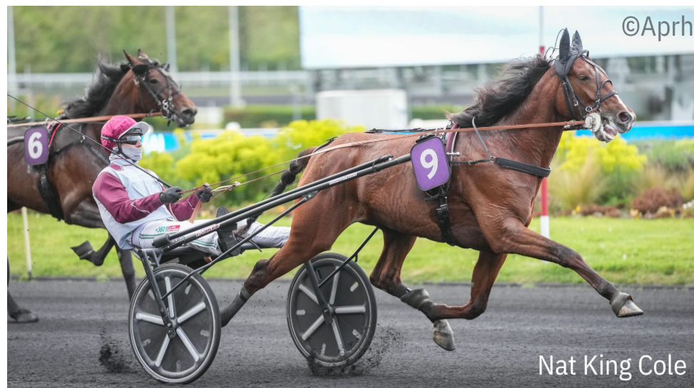
Nat King Cole