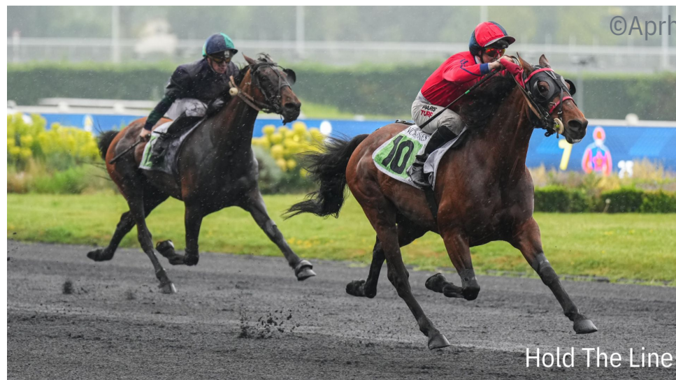
Hold The Line

4 e : Narco Connection - 5 e : Naliano d'Echal - 6 e : Notre Saxo d'Aure - 7 e : Navah Mercury