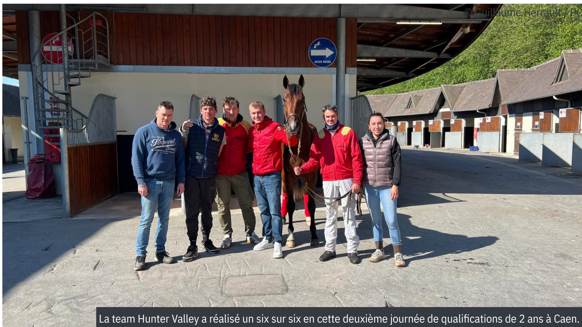
La team Hunter Valley a réalisé un six sur six en cette deuxième journée de qualifications de 2 ans à Caen.