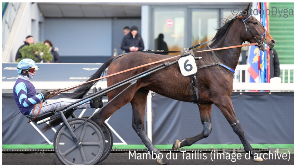
Mambo du Taillis (Image d'archive)