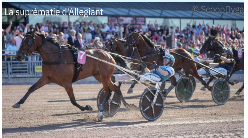
La suprématie d'Allegiant

3. Go On Boy (Password) 1'07"3 - R. Derieux