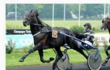
REAL DE LOU