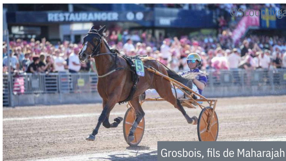
Grosbois, fil de Maharajah

Maharajah décroche le titre honorifique de meilleur étalon de la réunion de dimanche avec 3 gagnants. Il devance S. J's Caviar (2 gagnants) et une liste de huit étalons revendiquant un lauréat ( Pastor Stephen, Riff Kronos, Hard Livin, Password, Victor Gio, Tactical Landing, Ready Cash et Ready Express ).