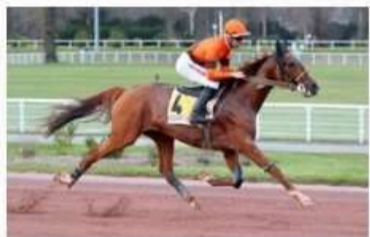
IN LOVE DU CHOQUEL