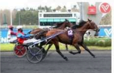
IN THE MONEY