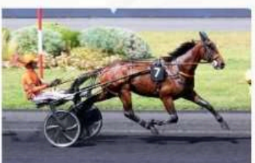
MAGNUM DU CHOQUEL