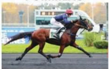
JAGUAR DU GOUTIER