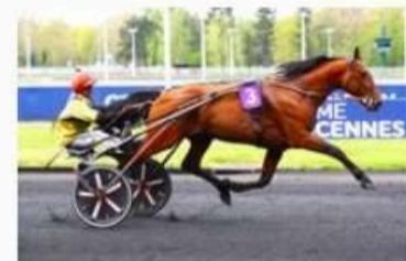
IT'S A DOLLARMAKER