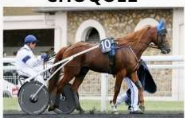
UN AMOUR D'HAUFOR