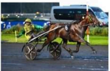
IDEAL DU POMMEAU