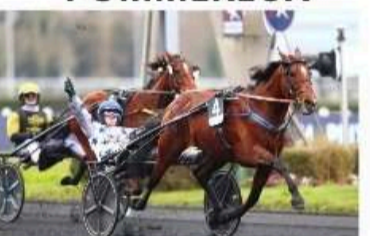
GO ON BOY