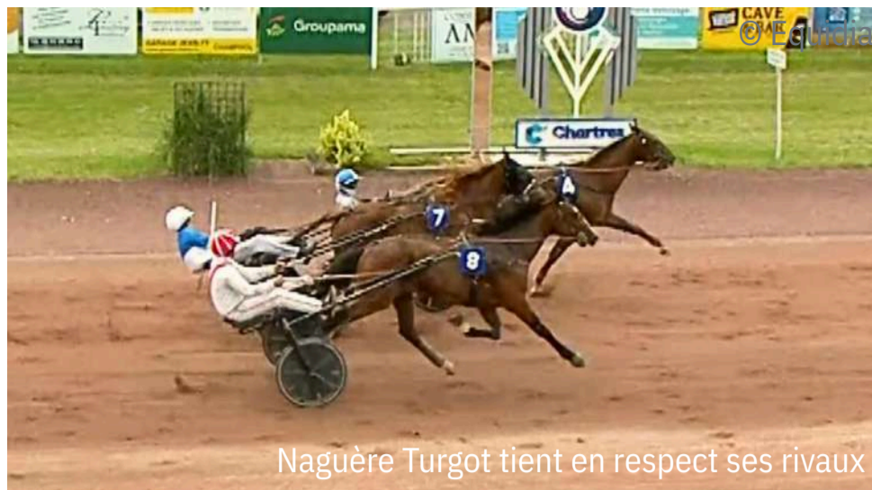
Naguère Turgot tient en respect ses rivaux