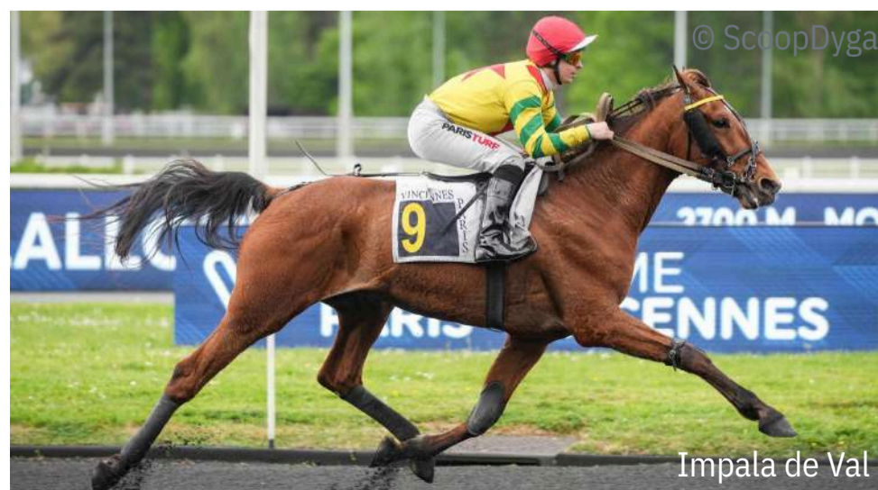
Impala de Val

I ls seront 11 à s'affronter dans le Prix Paul Delanoë (Groupe 3) mardi à Vincennes. L'épreuve sous la selle pour l'élite des chevaux d'âge se propose comme un nouveau volet du récent Prix Louis Sauvé (Gr.3). Hormis le vainqueur de cette épreuve, Indigo du Poret ( Dollar Macker ), on retrouvera en effet les principaux acteurs de la course, à savoir Idéale du Chêne ( Bird Parker ), Kyt Kat ( Booster Winner ), Filwell ( Qwerty ) et Kapaula de l'Epine ( Discours Joyeux ). Parmi les autres candidats au casting des deux épreuves, il y a bien sûr Impala de Val ( Viking de Val ), favori le 19 mai mais rapidement fautif et disqualifié. Jean Balthazar ( Alto de Viette ) et Fulton ( Royal Dream ) feront aussi l'enchaînement.