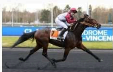
ICI C'EST PARIS