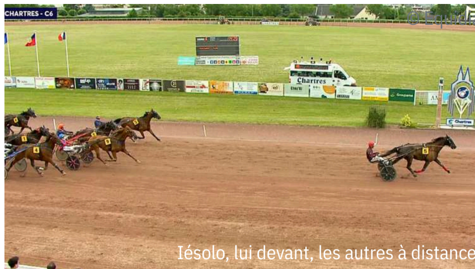
Iésolo, lui devant, les autres à distance