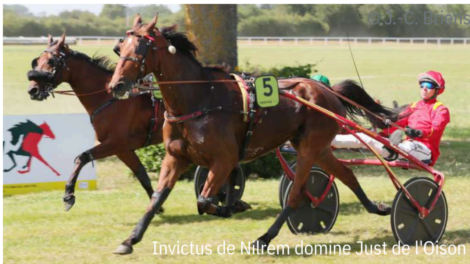
Invictus de Nilrem domine Just de l'Oison