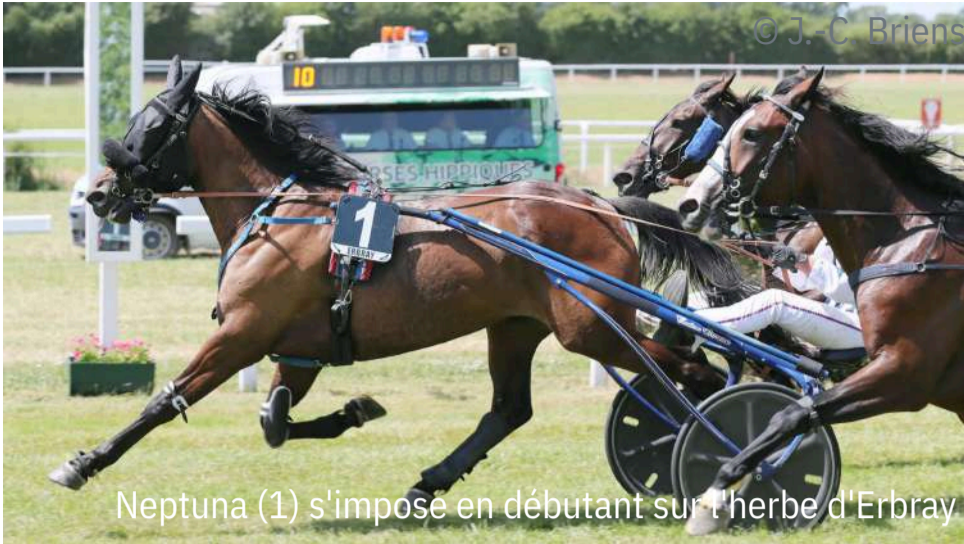
Neptuna (1) s'impose en débutant sur l'herbe d'Erbray