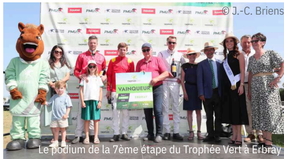
Le podium de la 7ème étape du Trophée Vert à Erbray