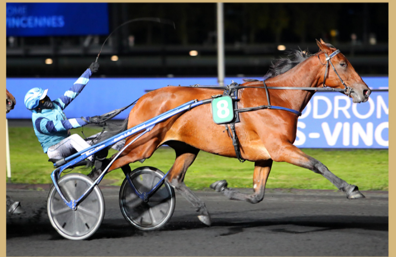
Championnat Européen des 5 Ans (Groupe 1)