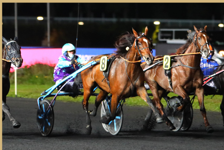
Grand Prix de l'UET (Groupe 1)