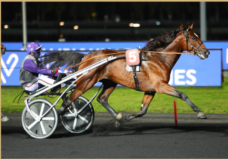
Championnat Européen des 3 Ans (Groupe 1)