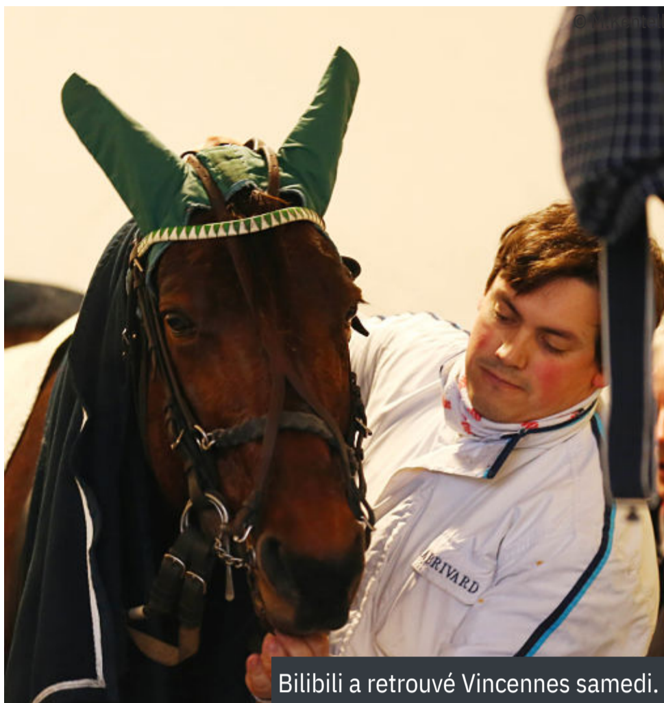
Bilibili a retrouvé Vincennes samedi.