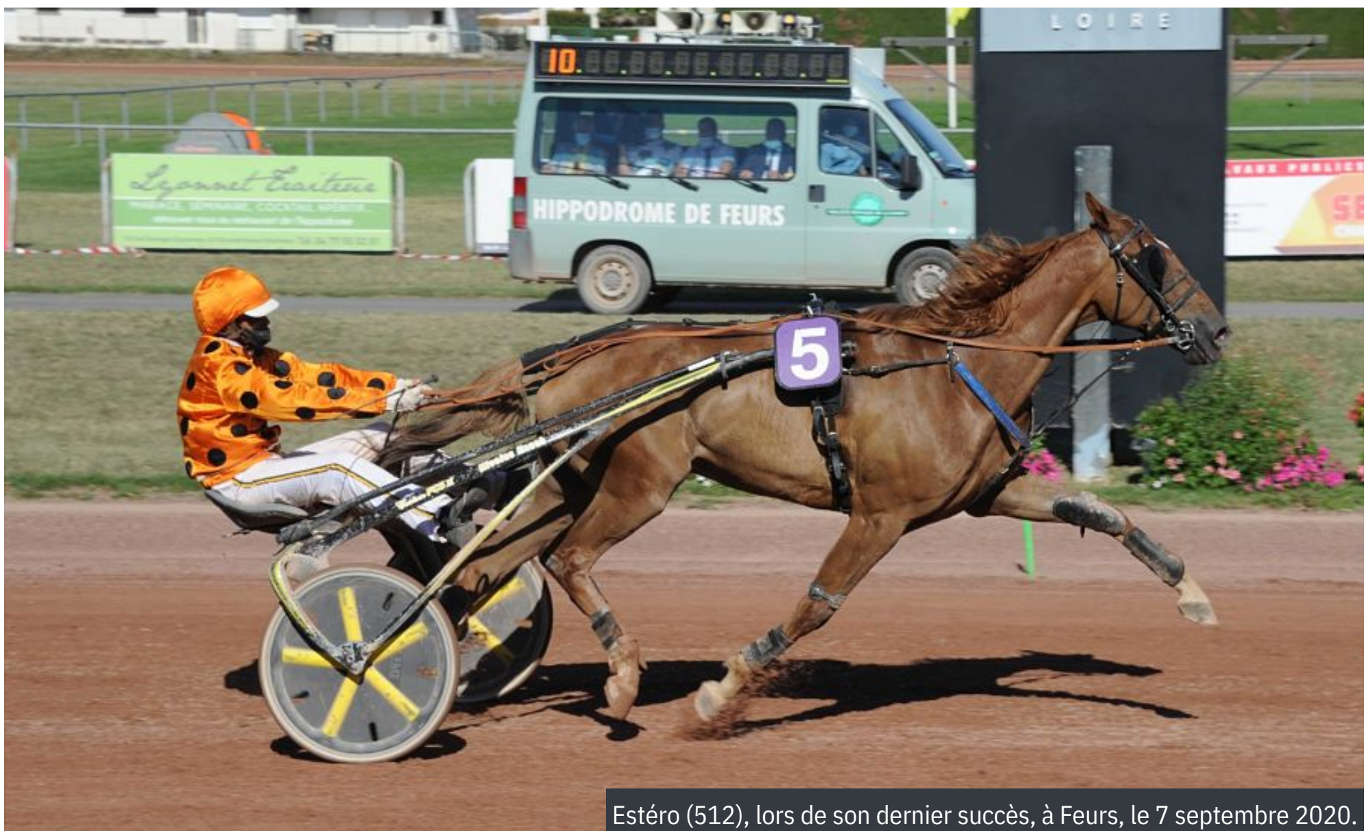
Estéro (512), lors de son dernier succès, à Feurs, le 7 septembre 2020.