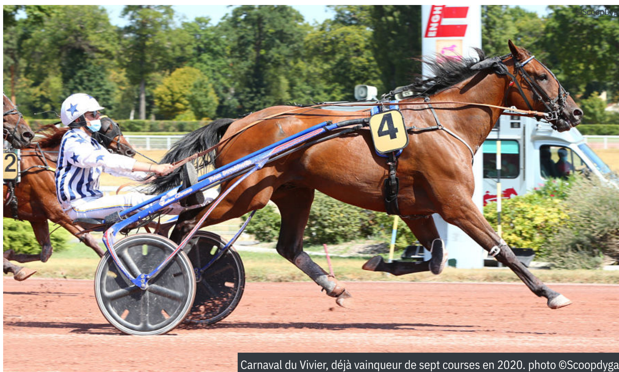
Carnaval du Vivier, déjà vainqueur de sept courses en 2020.