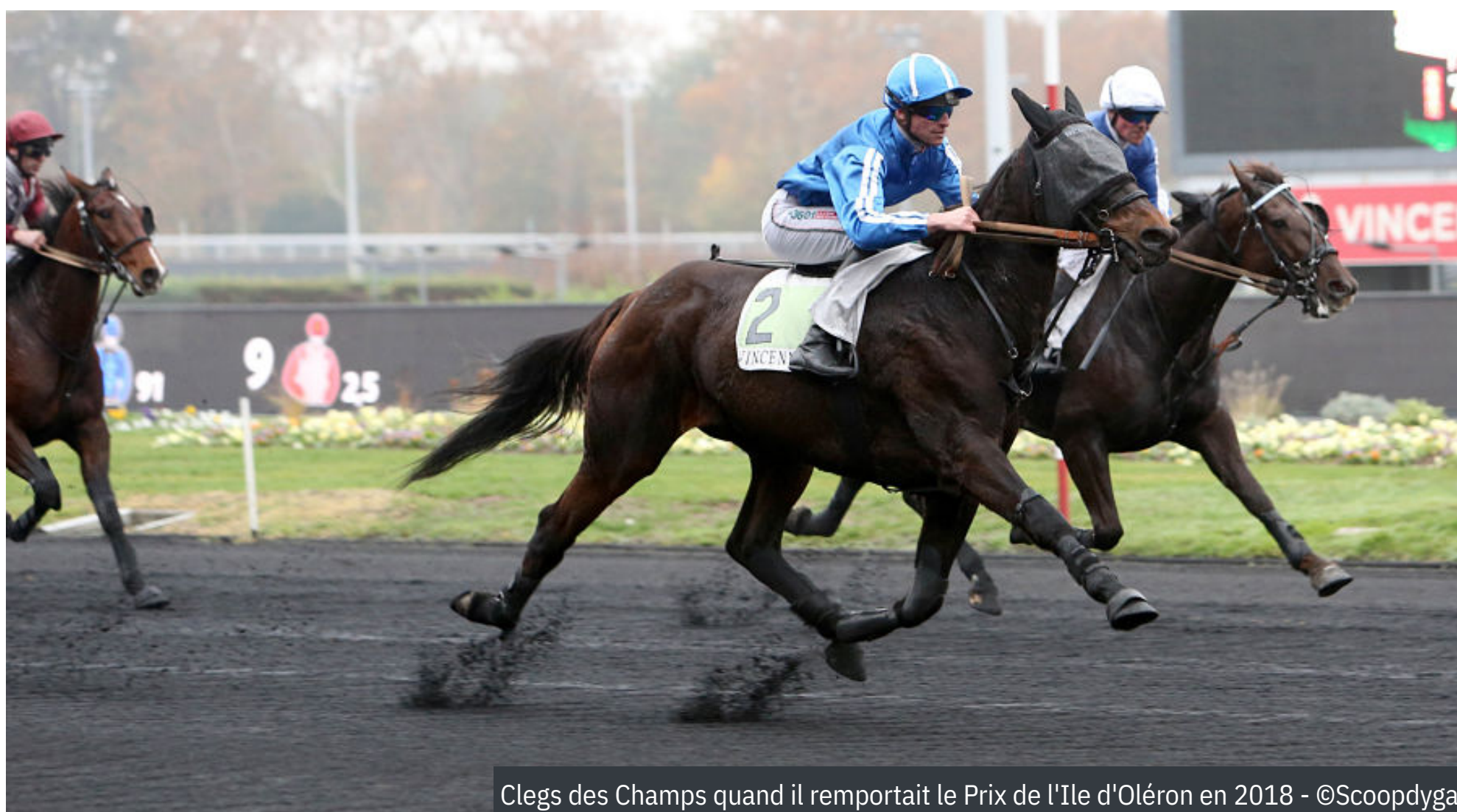
Clegs des Champs quand il remportait le Prix de l'Ile d'Oléron en 2018