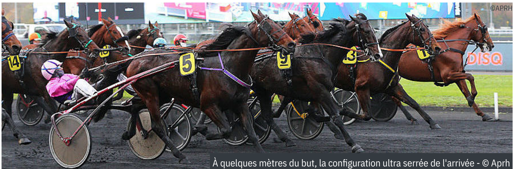
À quelques mètres du but, la configuration ultra serrée de l'arrivée