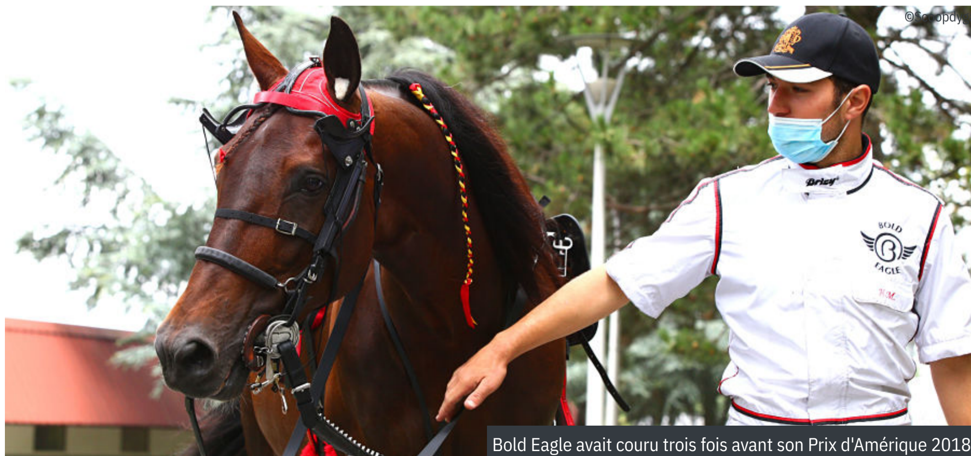
Bold Eagle avait couru trois fois avant son Prix d'Amérique 2018

Fiesta Du Belver, Husdon River (USA), Cléa Miquellerie, Altea De Piencourt, Elvis Du Vallon, Calle Crown, Jerry Mom, Fakir Du Lorault, Express Jet, Frisbee d'Am, Diable De Vauvert, Gotland, Moni Viking, Drôle De Jet, Feliciano, Bilooka du Boscail, Etoile de Bruyère, Chica de Joudes, Erminig d'Oliverie, Delia du Pommereux, Bahia Quesnot, Feeling Cash, Carat Williams, Bilibili, Face Time Bourbon. ■