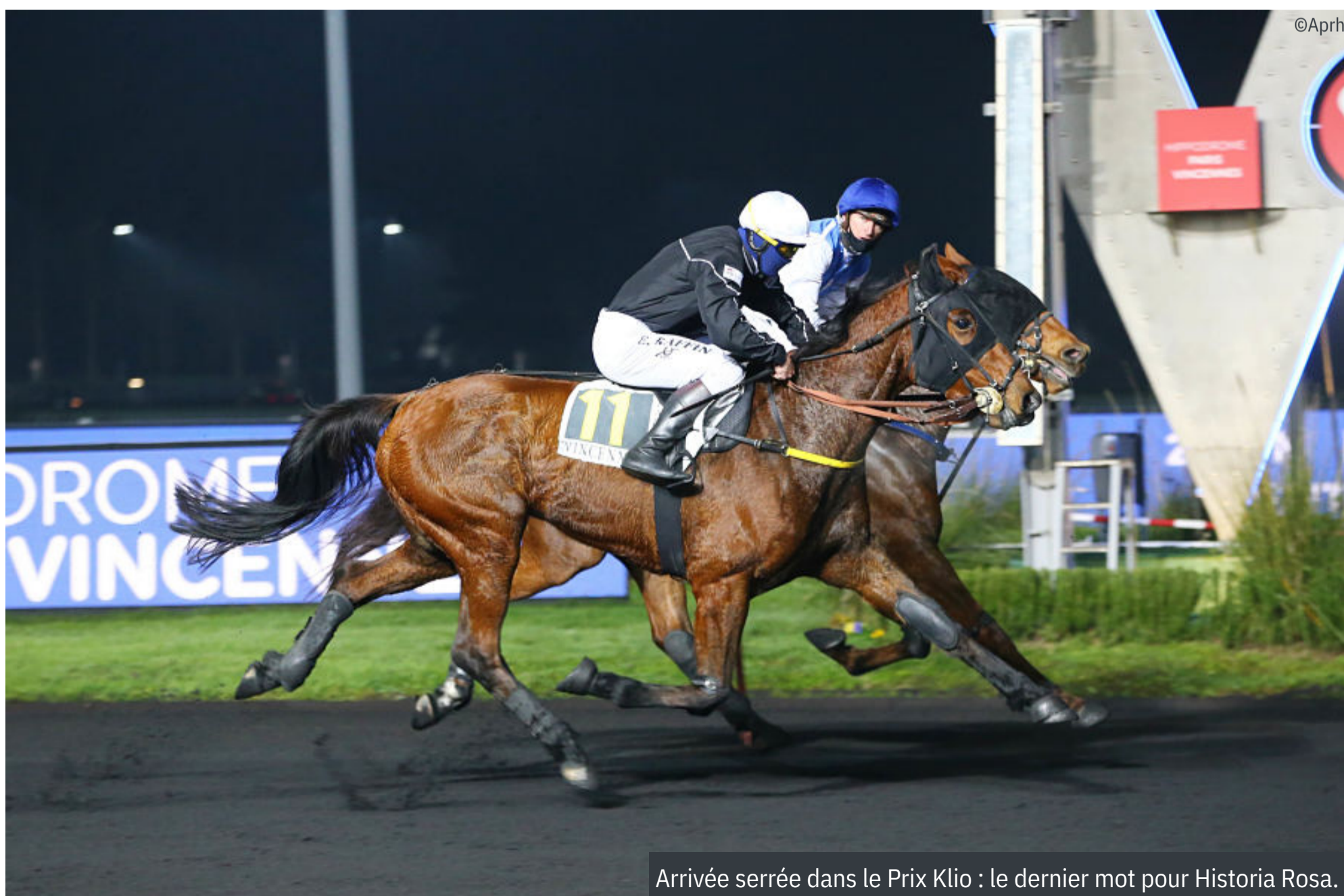
Arrivée serrée dans le Prix Klio : le dernier mot pour Historia Rosa.

4 e : Hibiki de Houelle - 5 e : Hazardous Game - 6 e : Hapicius - 7 e : Havrais