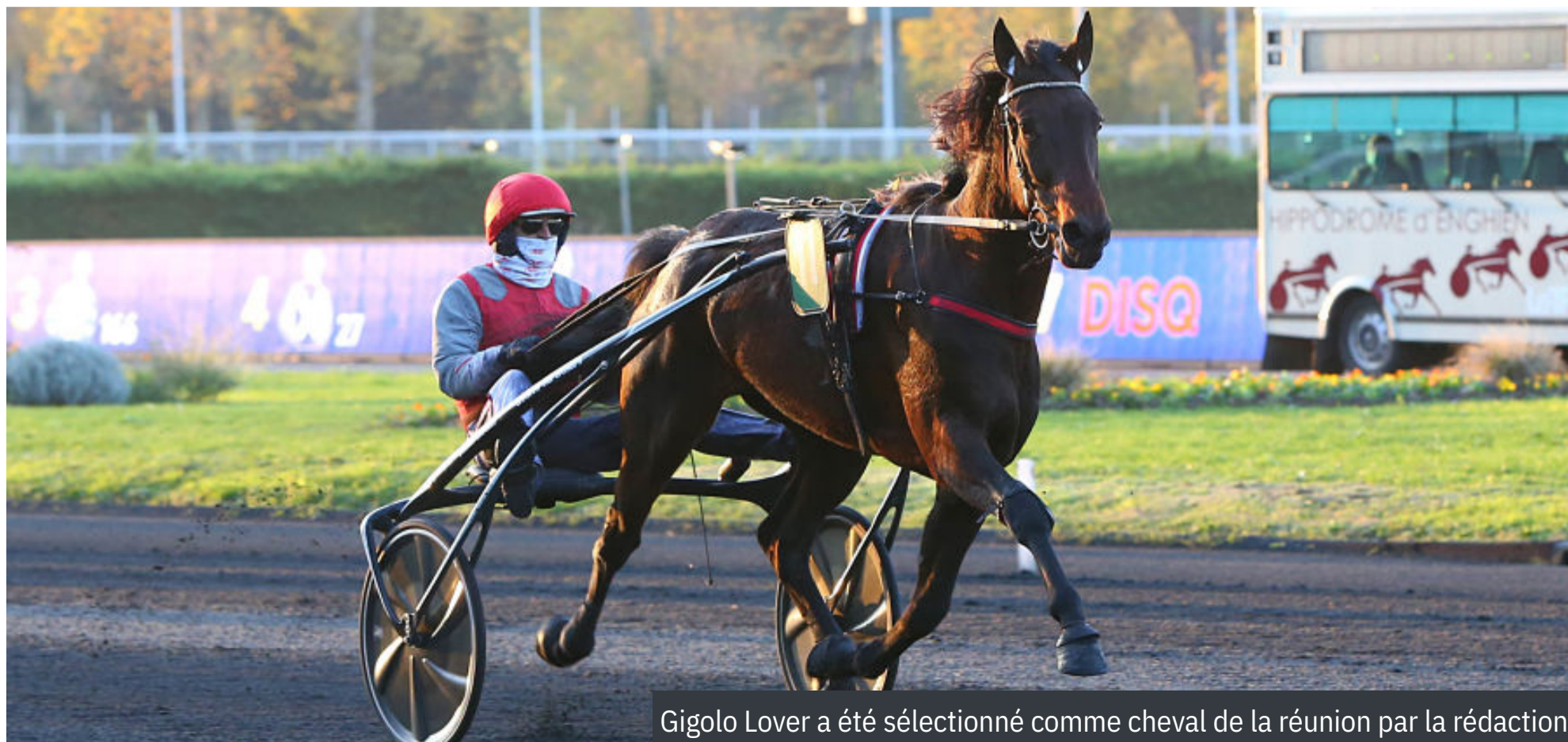
Gigolo Lover a été sélectionné comme cheval de la réunion par la rédaction