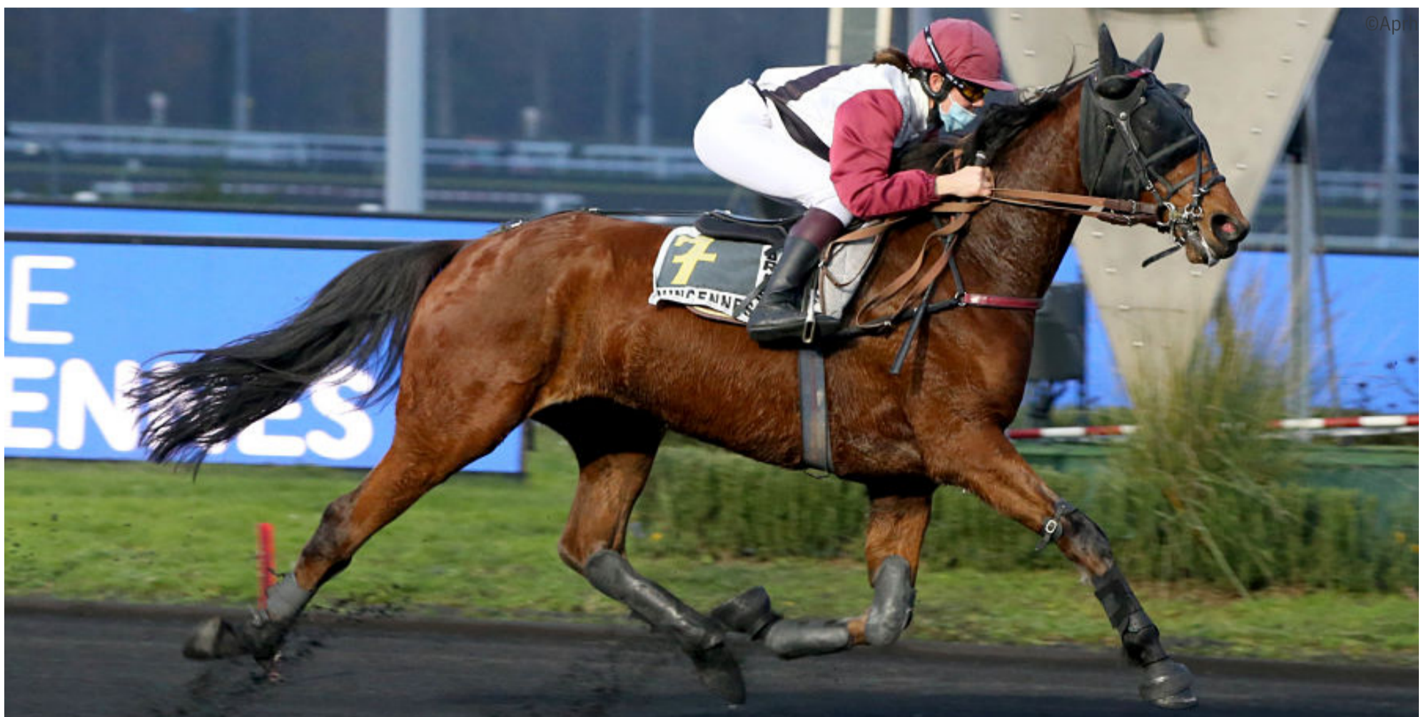
Héros du Pré a repris le cours de ses succès en remportant avec aisance le Prix de Machilly

4 e : Galactique Merite - 5 e : Galaxie d'Havane