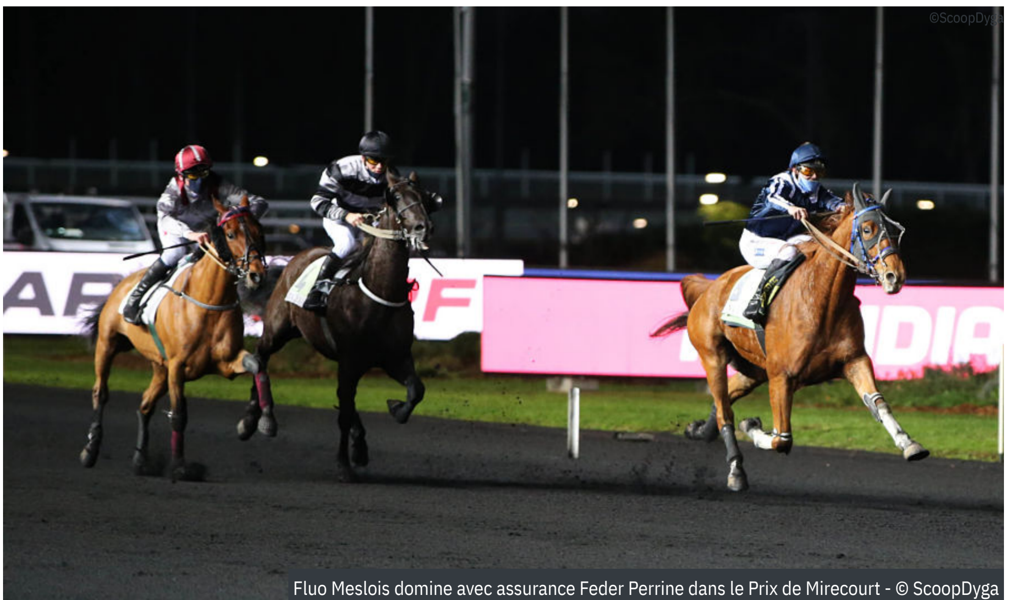
Fluo Meslois domine avec assurance Feder Perrine dans le Prix de Mirecourt

4 e : Hip Hop Haufor - 5 e : Handy Jet - 6 e : Hengy du Pommereux - 7 e : Horyvil des Moyeux