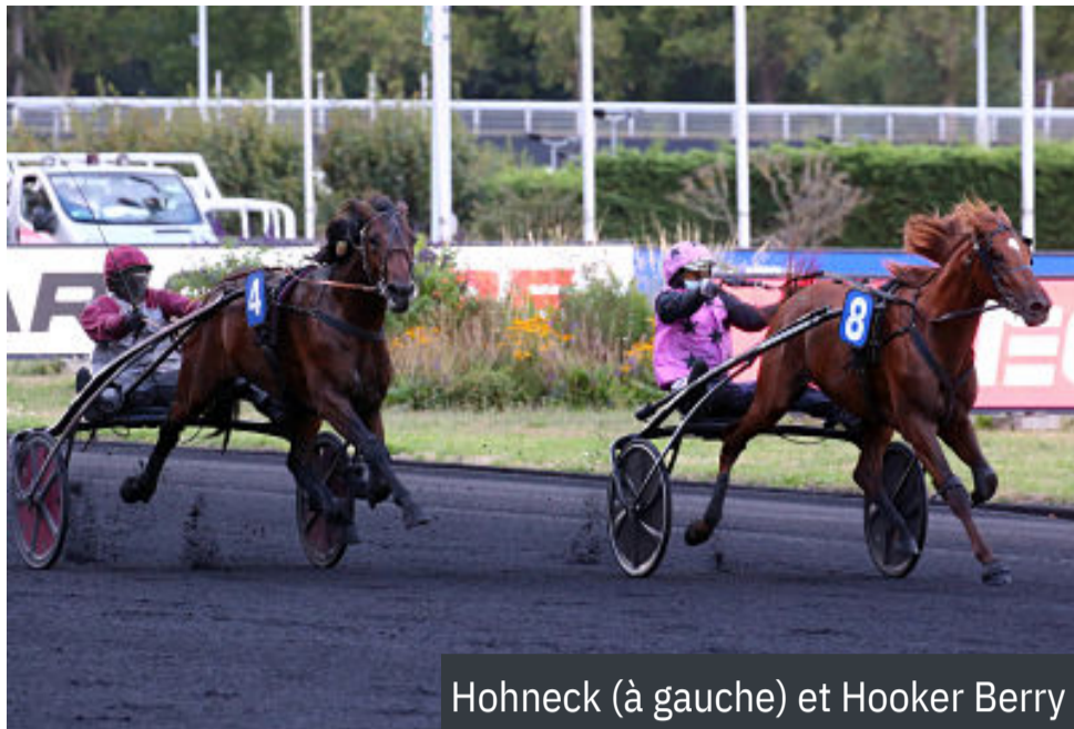
Hohneck (à gauche) et Hooker Berry